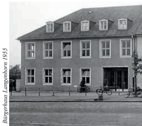
Bürgerhaus Langenhorn 1955

Weiter oben schrieb ich, dass wir in den letzten Jahren Tausende von neuen Einwohnern in Langenhorn hinzubekommen haben – aber zum Ankommen bedarf es mehr als Wohnungen und ein Einkaufszentrum! Wir brauchen öffentliche und für alle zugängliche Räume für Kultur, für