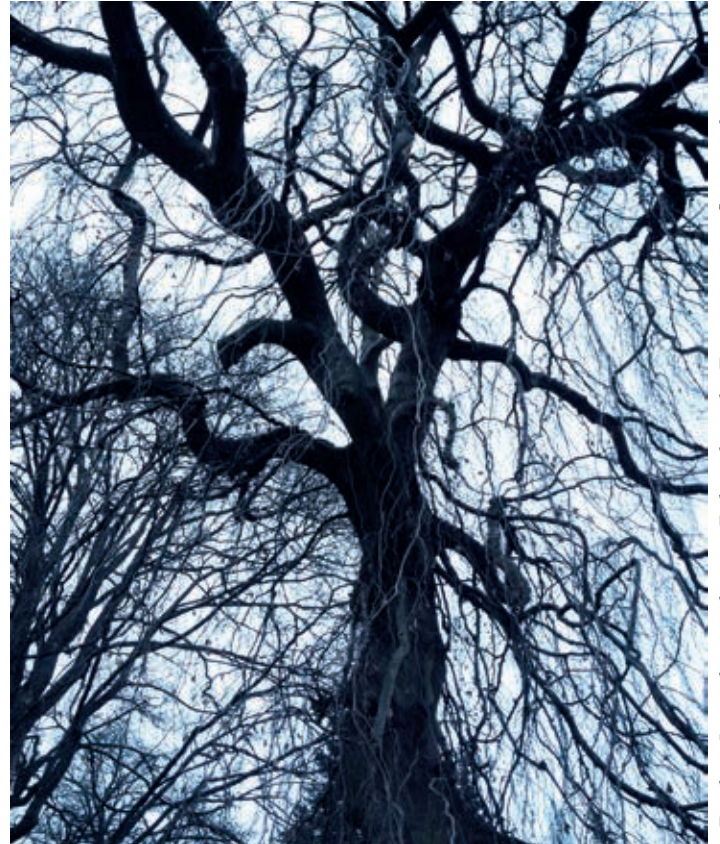
Es gibt in Langenhorn noch einige Eichen, die in der Franzosenzeit gepflanzt wurden.

„Aber Wachstum ist ein Naturgesetz“, wird mir entgegengehalten. Überlegen Sie selbst: Wieviel wachsen Sie im Jahr, seit Sie „erwachsen“ sind? In der Biologie hat alles und jedes seine Größe - nichts kann über Jahrhunderte unendlich weiterwachsen. Und: Von Natur aus ist alles Wachsen zwingend mit Vergehen verbunden. Ja, jährlich wachsen Millionen Tonnen von Laub, von Früchten, wachsen Tiere aller Art heran. Aber sie alle haben eine begrenzte Zeit - dann vergehen und verschwinden sie, die Natur wirkt in Kreisläufen. Dass etwas immer weiter nur wächst ist eine ideologische, von Menschen