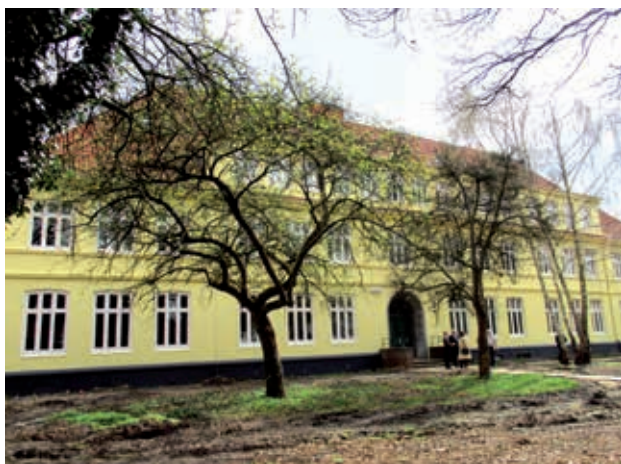
Integration in Langenhorn: Die Süderschule zeigt, wie es geht.

In Bezug auf den Sozialen Zusammenhalt im Bezirk verwundert das Fehlen eines jeglichen Bezugs auf das 2017 neu aufgelegte Hamburger Integrationskonzept „Wir in Hamburg“ für Teilhabe, Interkulturelle Öffnung und Zusammenarbeit. Auch an ein bezirkliches Integrationskonzept, so wie im Bezirk Altona schon seit 2011 existent, ist im Bezirk Hamburg-Nord offenbar nicht gedacht. Im Bezirk Hamburg-Nord ist der Stadtteil Langenhorn nach Dulsberg und Hohenfeld der Stadtteil mit dem höchsten Bevölkerungsanteil mit Migrationshintergrund. Auch aus diesem Grund wäre in Langenhorn die Einrichtung eines Kultur- und Begegnungszentrums mit interkulturellen Programmangeboten nicht nur für ein