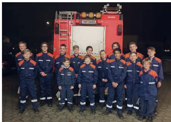
Die Gruppe vor einer Einsatzübung an einem Mittwochabend im November