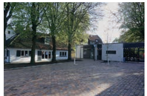
Dorfplatz mit Kinderkrippe und Jugendhaus