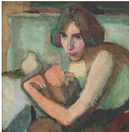
Jeanne, um 1909, Privatbesitz

1907 reist Nölken, inspiriert von Neo-Impressionisten wie van Gogh und Gauguin, erstmals nach Paris. Zurück in Deutschland war er für kurze Zeit Mitglied in der Künstlergruppe „Brücke“, doch das expressionistische Motto, Wahrnehmungen spontan und direkt auf die Leinwand zu bringen, entsprach nicht seinem zurückhaltenden, nachdenklichen