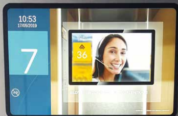
HARABAU: Aktuelle Bauvorhaben – Seite 4