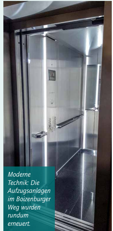
Moderne Technik: Die Aufzugsanlagen im Boizenburger Weg wurden rundum erneuert.

Die Sanierung der Fassade und des Daches im Buchenkamp 41-45 in Volksdorf musste leider auf das nächste Jahr verlegt werden. Bedauerlicherweise konnten wir nicht alle Gewerke in der Terminabstimmung für uns gewinnen. Aber heute schon ist geplant, die Baumaßnahme in 2020 auszuführen.