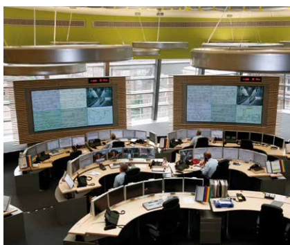
AUSFLÜGE: Blick hinter die Kulissen der Hochbahn – Seite 18