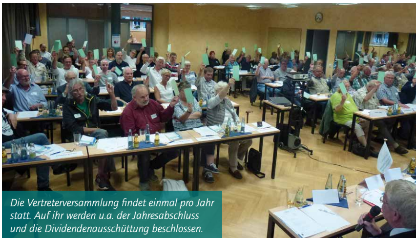
Die Vertreterversammlung findet einmal pro Jahr statt. Auf ihr werden u.a. der Jahresabschluss und die Dividendenausschüttung beschlossen.

Sie finden den Geschäftsbericht auch als PDF-Dokument zum Download auf unserer Internetseite www.harabau.de im Bereich Mieterservice/Download.