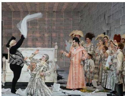
FÖRDERUNG DER GEMEINSCHAFT: Rahlstedter Theaterbus auf Tour – Seite 8