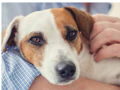
HARABAU: Der beste Freund des Menschen – Seite 6