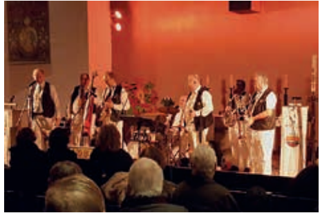
Limehouse Jazzband