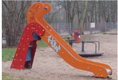
(Spielplatz Arnswalder Straße)