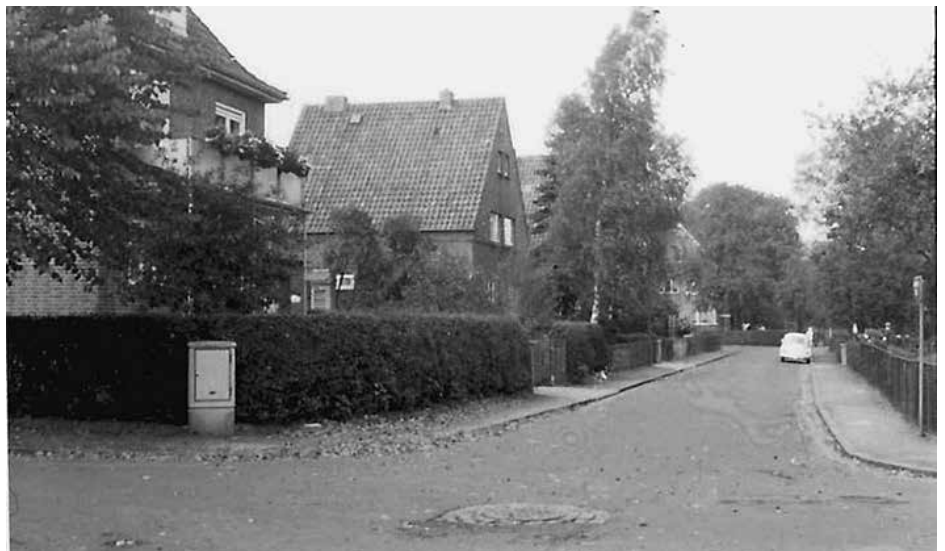
Die Hermann-Renner-Straße 1962