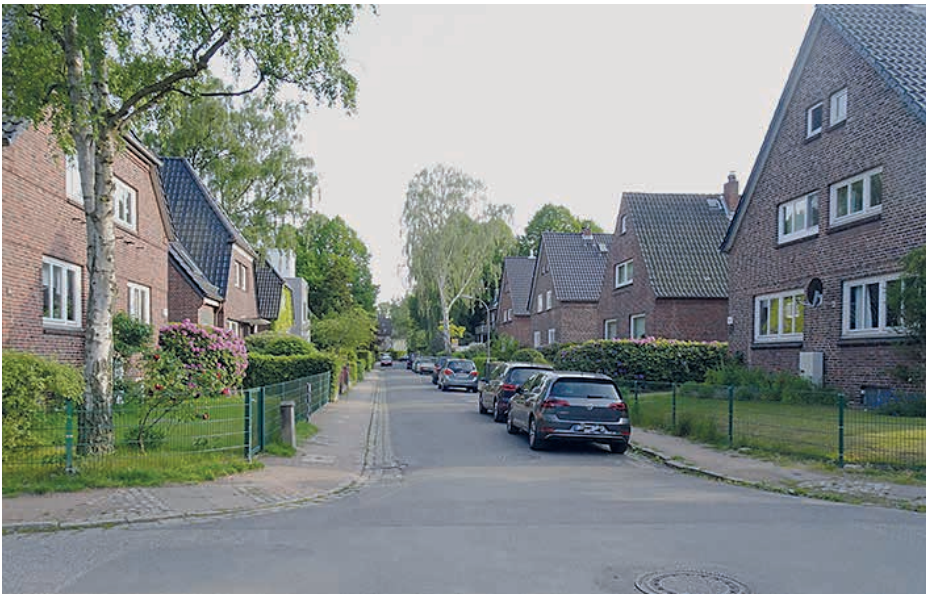
und heute