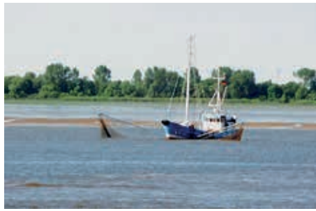
Ein Fischerboot im Mühlenberger Loch

Mit dem Ende der letzten Eiszeit (vor gut 10 000 Jahren) tauchen nun auch Menschen in unserer Region auf: Rentierjäger durchstreifen das breite, oft versumpfte Elbtal. Die Pflanzenwelt entspricht mit Zwergbirken, Kriechweiden, Flechten und Moosen der Tundra z.B. Sibiriens. Es wird weiterhin langsam wärmer, die ersten Menschen werden sesshaft, aber es kommt immer wieder