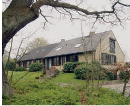
Ein Doppelhaus der Siedlung

stücksgrenzen nicht sichtbar zu markieren und zur Straße hin keine Zäune zu errichten. Die Siedlung sollte sich in die Landschaft einfügen und die Grünflächen für alle nutzbar sein. Dieses offene Bauen