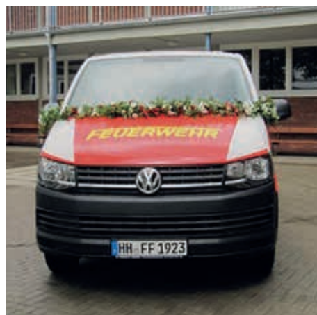
Wolfgang Cordts konnte bei der Gelegenheit, den neuen VW-Bus für die Jugendfeuerwehr vorstellen, der Dank großzügiger Spenden angeschafft werden konnte.

de, oft ist sie sogar schneller vor Ort als die Berufsfeuerwehr, sie sorgt auch bei den Osterfeuern für Sicherheit, stellt die Brandsicherheitswache beim Spring- und Dressurderby, gewährleistet mit einem Kleinboot die Absicherung des Hafengeburtstages usw. Die Aufgaben für unsere Sicherheit sind vielfältig. Schätzen wir uns glücklich, dass wir die FFN haben!