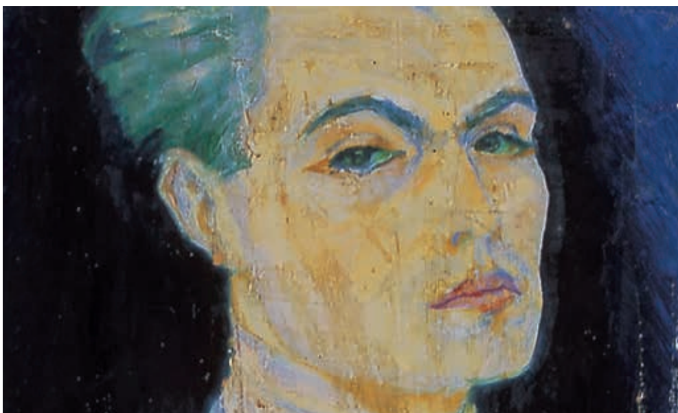
Eduard Bargheer: Selbstbildnis, 1927 (Ausschnitt), Eduard Bargheer Nachlass © VG Bild-Kunst, Bonn 2019