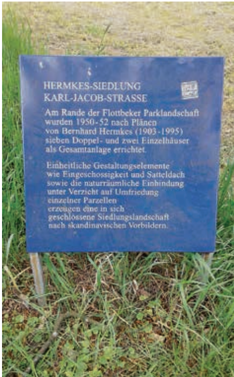
Hinweistafel auf die „Siedlung Klein Flottbek“

Will man vom Bahnhof Klein Flottbek durch die Karl-Jacob-Straße in Richtung Elbe, weist gleich zu Beginn eine blaue Tafel unter einer Birke auf ein architektonisches Kleinod hin: Die Siedlung Klein Flottbek.