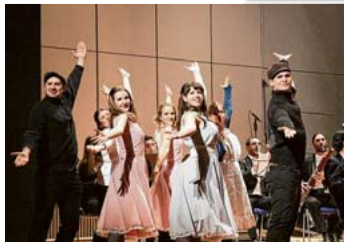
Das Solistenensemble des Music rocks-Chores

POPPENBÜTTEL Stimmvolle und mitreißende Solonummern und Ensembleleszenen stehen auf dem