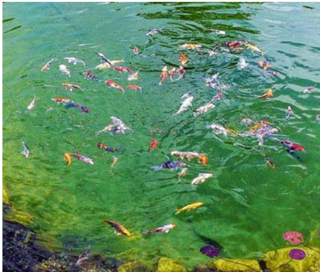
Die bunte Fischwelt im Gartenteich findet in Deutschland immer mehr Liebhaber. Allerdings brauchen die Unterwasserbewohner auch etwas Pflege, um munter ihre Bahnen zu ziehen

Im mit aktiviertem Sauerstoff angereicherten Wasser entsteht zudem ein Milieu, in dem Algen nur schwer existieren und sich schon gar nicht explosionsartig vermehren können. Doch damit der Teich nicht aus seinem Gleichgewicht gerät, sollten die Fische auch richtig gefüttert werden. Ein Zuviel an Nährstoffen und überschüssigen Abbauprodukten im Wasser trägt zum Sauerstoffmangel bei und setzt giftige Gase im Wasser frei. Die Unterwasserbewohner sollten ein- bis zweimal pro Tag mit schonend hergestelltem, leicht verdaulichem Markenfutter versorgt werden. Das Futter wird dabei gleichmäßig über eine größere Fläche