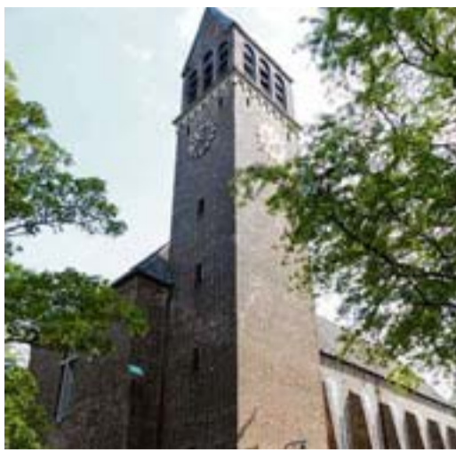
Gut ein Kilometer Luftlinie trennt die zwei Kirchengebäude der evangelischen Gemeinde Volksdorf: St. Gabriel am Ende der Sackgasse Sorenrem (links) und der Rockenhof, zentral gelegen am U-Bahnhof

Leser-Echos eine kontroverse Diskussion. Der KGR beschloss zudem eine Stellungnahme, die wir hier abdrucken: