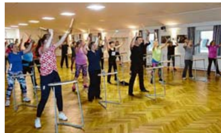
Auch Fit4Drums kann beim Summer Special ausprobiert werden

VOLKSDORF Volksdorf Bereits zum vierten Mal findet vom Gesundheits- und Fitness-Studio des Walddörfer Sportvereins ein Summer Special mit einem erweitertem Angebot für alle Sport- und Fitnessbegeisterten statt. In den Räumen des Walddörfer Sportforum werden im Stundenrhythmus ganz unterschiedliche Trainings angeboten. Neben den klassischen Summer Special Angeboten wie Yoga, Zumba und Pilates gibt es zum