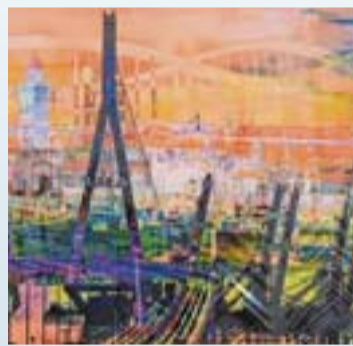
Hamburger Panoramen in einem vielschichtigen Werk. Dies und mehr immer dienstags bis freitags in der Kunsthandlung Alstertal