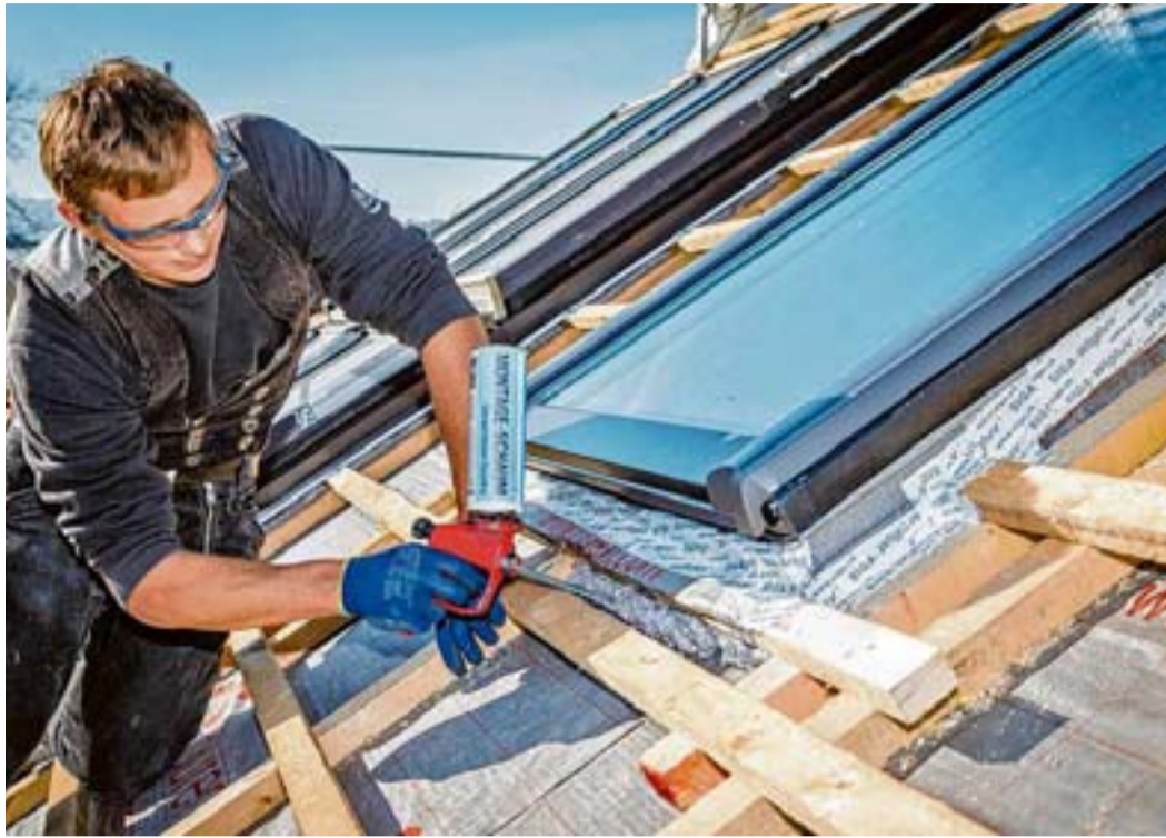
Mit dem Einbau moderner Isolierglasfenster lassen sich Wärmeverluste drastisch reduzieren - aber, auch ein Hightech-Fenster ist nur so gut wie seine Fugendämmung

Durch den Einbau moderner Isolierglasfenster beispielsweise kann man sich im Winter nicht nur vor Kälte schützen, sondern im Sommer eben auch vor Hitze. Was viele Sanierer nicht beachten: Damit dieser Wärmeschutz wirklich funktioniert, benötigen auch Hightech-Fenster eine optimale Fugendämmung. Ein Vergleich zwischen den verschiedenen Fugendichtungen zeigt, dass PU-Schaum die niedrigste Wärmeleitfähigkeit und daher die besten Isoliereigenschaften aufweist. Dies verdankt er seiner geschlossen feinzelligen Struktur, die wirkungsvoll die Übertragung von Wärme und Kälte verhindert.