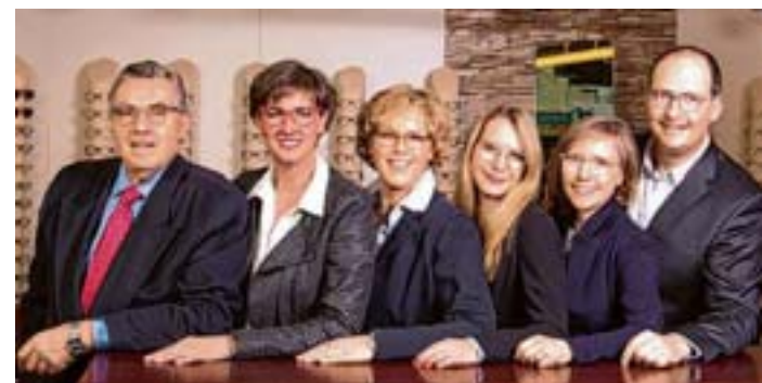
Das freundliche Johann-to-Settel-Team bietet einen exzellenten Rundum-Service

fessionelle Sehstärkenmessung mit neuester Technik, Augendruckmessung, Bildschirmarbeitsplatz-Sehtests, Beratung, Anpassung von vergrößernden Sehhilfen und Lupenbrillen, Hol- und Bring-service und natürlich Kontaktlinsen-anpassung. Spezialisiert ist man bei Johann-to-Settel vor allem auf Gleitsichtbrillen, Sehhilfen für Makuladegeneration und Sehanalysen mit Augeninnendruckmessung. Das Besondere: Das freundliche, voll ausgebildete Augenoptiker-Team bietet nicht nur in jedem Preissegment