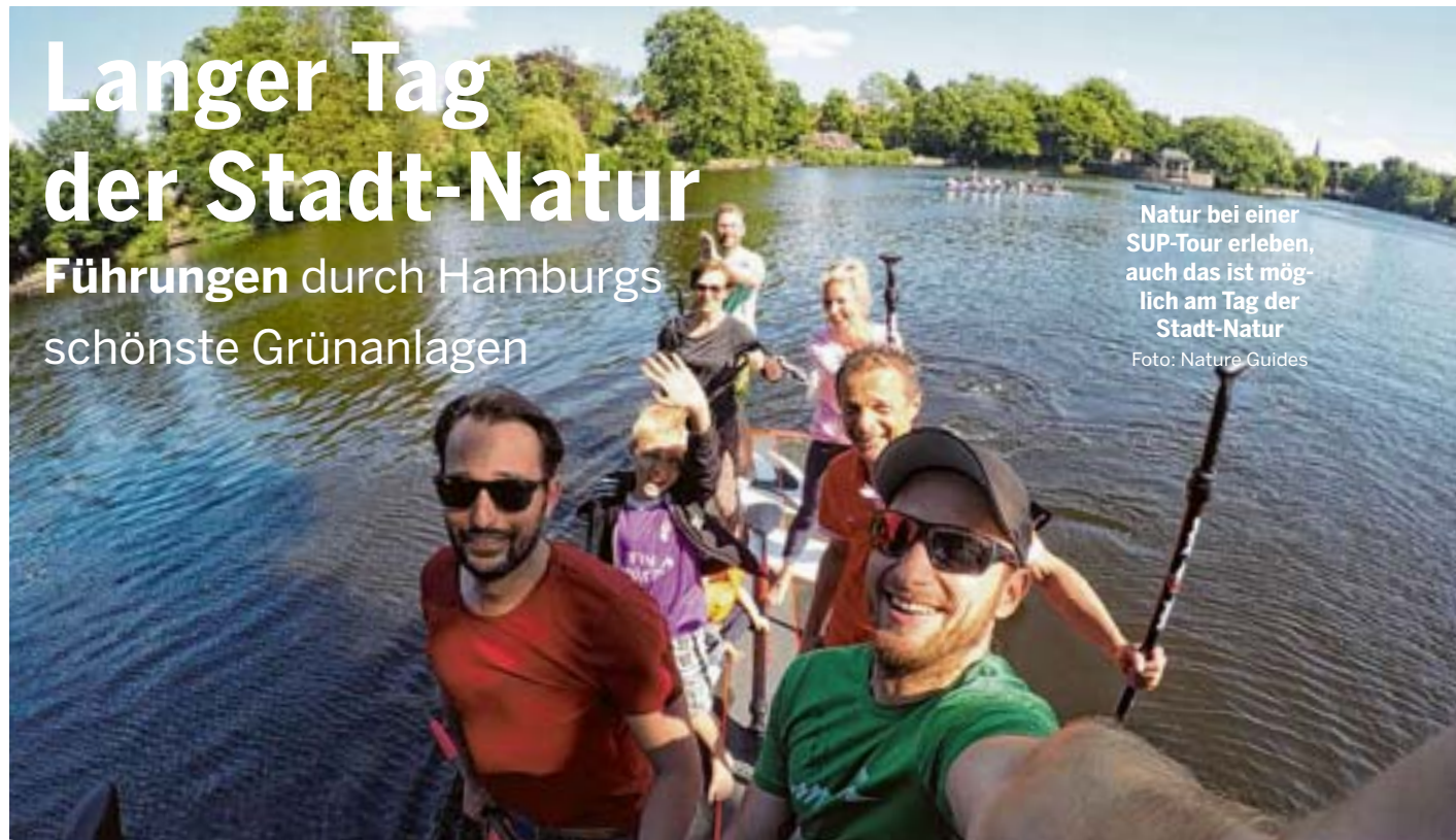
Natur bei einer SUP-Tour erleben, auch das ist möglich am Tag der Stadt-Natur

HAMBURG Die Wanderschuheschnür und auf zu Hamburgs größtem Natur-Event: Am Wochenende 15./16. Juni ist „Der Lange Tag der Stadt-Natur“, ein Erlebnis draußen und im Freien mit Führungen durch Hamburgs schönste Grünanlagen, Parks und Naturgebiete. 30 Stunden mit rund 220 Aktivitäten zu Wasser und an Land. 100 Veranstalter werden wieder ein buntes Spektrum für jedes Alter anbieten.