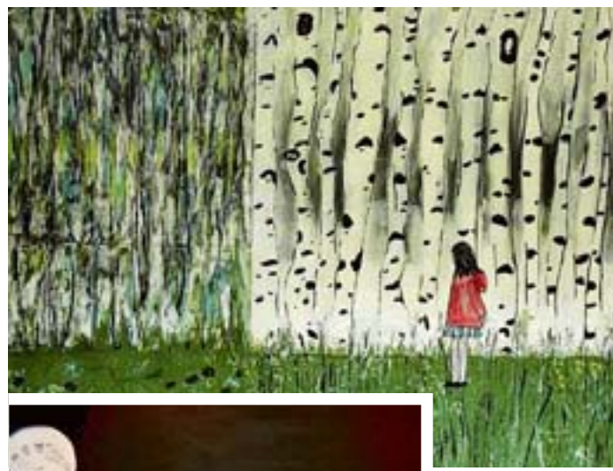
oben: Birkenwald links: Klimawandel tut weh

WOHLSDORF-OHLSTEDT Die Hamburger Künstlerin Bärbel Fleischer zeigt in ihrer Ausstellung „NaturART“ aktuelle Acrylarbeiten und Collagen zum Thema „Klimawandel tut weh.“ Seit ihrer Kindheit gehören Farbe und Pinsel zu ihrem Leben, beruflich war sie viele Jahre als Grafikerin tätig. Seit 13 Jahren betreibt sie eine Malerschule und seit 1990 stellt sie ihre zum Teil großformatigen, mal abstrakten mal realistischen, Arbeiten aus. Sie liebt kräftige Farben. Zur-