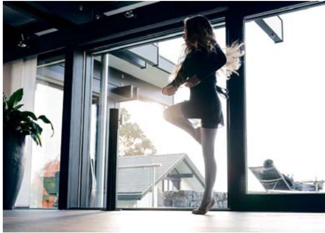
Prima Klima bei jedem Wetter: Spezialverglasungen verhindern, dass sich das Zuhause an heißen Tagen zu stark aufheizt

Die Spezialverglasung schlägt zwei Fliegen mit einer Klappe: Tageslicht kann weiter die Räume fluten und für eine sommerlich-fröhliche Atmosphäre sorgen. Gleichzeitig