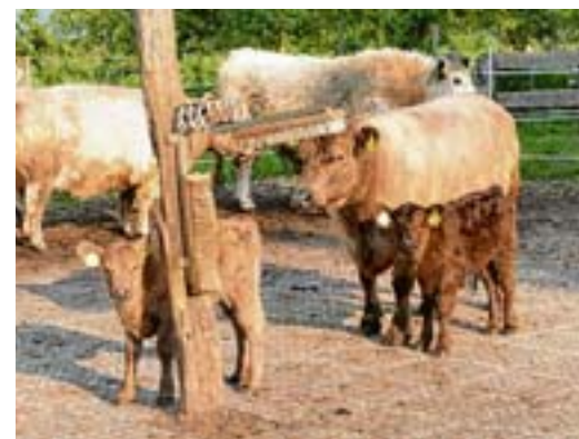
Nachwuchs bei den Galloway-Rindern am Stüffel erfreute die Eltern und menschliche Betrachter gleichermaßen