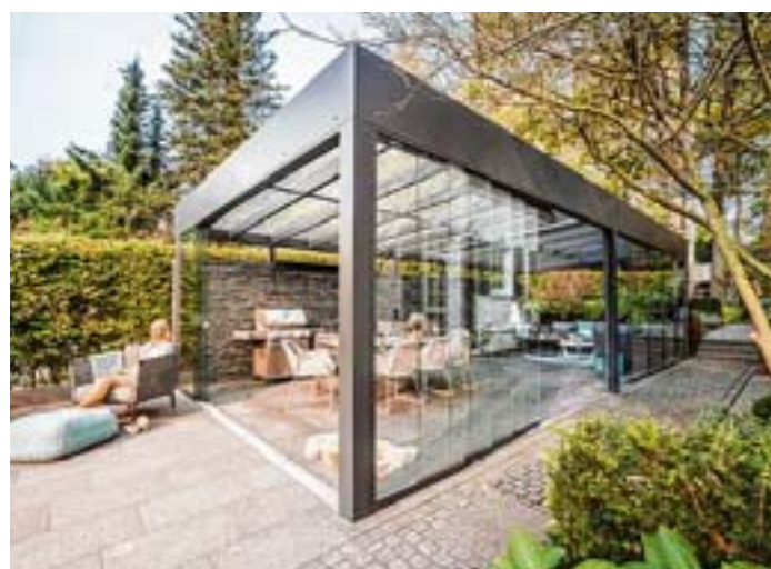
So geht Wintergarten heute

Was in den Bereichen Wintergärten alles möglich ist, lässt sich bei HATRU erleben.