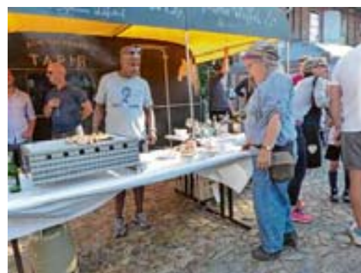
Beim „Goldenen Tapir“ gab es Flüssiges, Waffeln und Würstchen