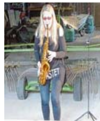
In der Maschinenhalle des Gärtnerhofs erklang Beschwingtes