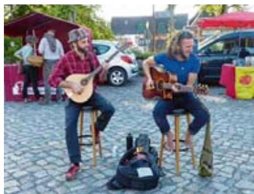
Premiere für den Bergstedter Feierabendmarkt: Entspannt ging's auch in musikalischer Hinsicht zu

info@bestattungen-eggers.de www.bestattungen-eggers.de