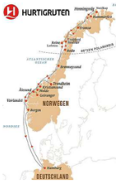
Auf dieser Route geht es mit Hurtigruten gen Norden

Sie gilt seit über 125 Jahren als schönste Seereise der Welt: die Fahrt entlang der Fjordküste Norwegens zwischen Bergen und Kirkenes mit den Hurtigruten. Im Mittelpunkt der Postschiffreise steht die unvergleichliche norwegische Natur. Pausenlos wechseln sich beeindruckende Fjorde mit massiven Bergketten ab, begleitet von malerischen Inseln und einer Vielfalt kleiner bunter Fischerorte. An Bord geht es gemütlich und leger zu, ganz ohne Kreuzfahrtetikette. Das Reisebüro TUI TravelStar Reisebonbon vertritt in Hamburg die norwegische Reederei und gibt individuelle Tipps. Denn es sind Kleinigkeiten, die auf dieser beratungswichtigen Reise und während des Aufenthalts an Bord dem Gast einen noch größeren Mehrwert bringen: Worauf sollte der Gast bei seiner Kabinwahl achten, welches Schiff ist