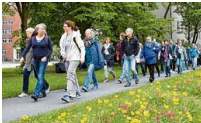
Die Horner Geest ist ein Grünzug, den viele Hamburger gar nicht kennen

HAMBURG Die Wanderschuheschnür und auf zu Hamburgs größtem Natur-Event: Am Wochenende 15./16. Juni ist „Der Lange Tag der Stadt-Natur“, ein Erlebnis draußen und im Freien mit Führungen durch Hamburgs schönste Grünanlagen, Parks und Naturgebiete. 30 Stunden mit rund 220 Aktivitäten zu Wasser und an Land. 100 Veranstalter werden wieder ein buntes Spektrum für jedes Alter anbieten.