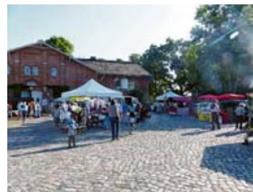
Der historische Bergstedter Ortskern bot den passenden Rahmen für das neue Format