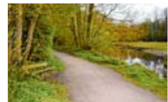
Eine idyllisch gelegene Bank an der Alster

BERGSTEDT Der Heimatring Bergstedt e.V. lädt wieder zu einem der beliebten Rundgänge durch den Stadtteil ein. Diesmal wird der Norden erkundet: ein Teil des geplanten Wanderwegs durch Bergstedt, weitgehend durch die teils geschützte Natur. Die Wanderung wird etwa zweieinhalb Stunden dauern, deshalb bitte Getränke mitbringen. Die Teilnahme