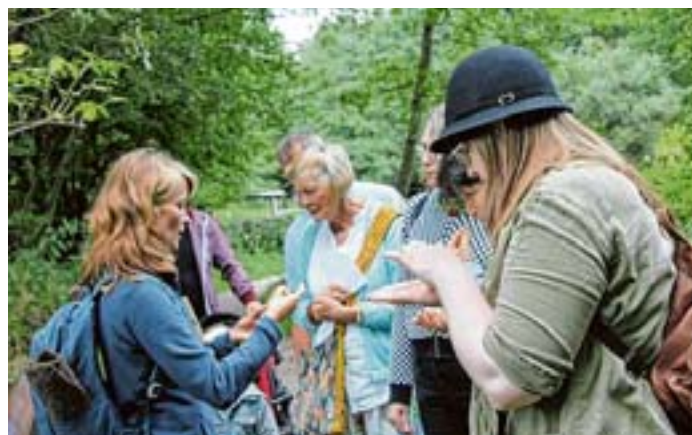
Wildkräuter am Wegesrand sind wichtig für das Überleben der Insekten

Voller spannender Dinge, die es zu entdecken gibt, präsentieren sich die Veranstaltungen für Kinder. Wer möchte nicht einmal in die „Farbtöpfe der Baumhexe“ schauen oder „die Honigbienen besuchen“. Die kleinen Naturdetektive kommen Vielem auf die Spur, was nicht in den Schulbüchern steht und erfahren viele Details über die Natur im Garten oder Park um die Ecke. Natur erleben, dazu bietet der Lange Tag der Stadt-Natur alle Möglichkeiten – in einmaliger Vielfalt.