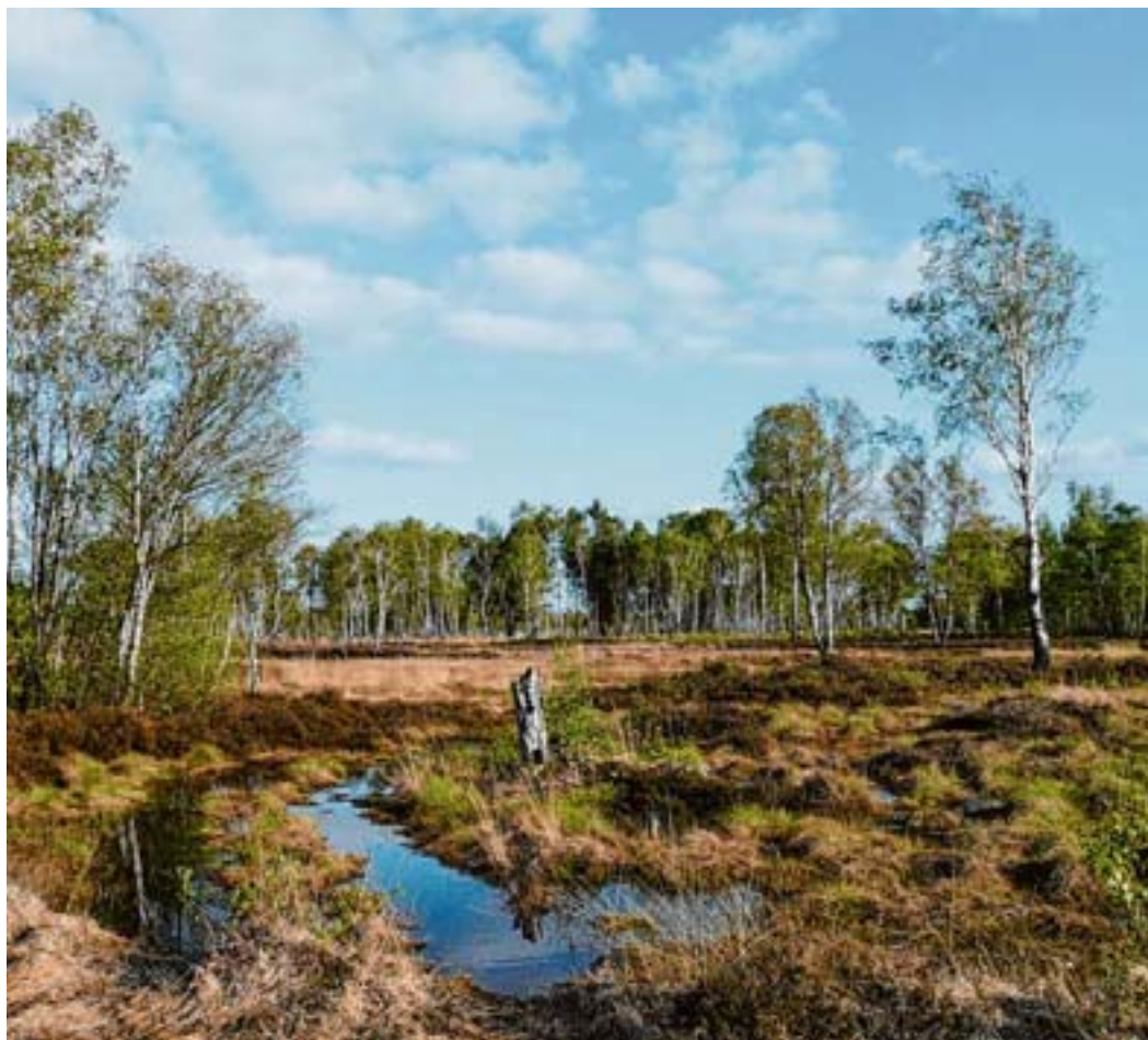
Die Erhaltung der Moore ist für Tier- und Pflanzenarten sehr wichtig

Das gegenwärtige Landschaftsbild des Duvenstedter Brooks formierte sich nach der letzten Eiszeit vor circa 15.000 Jahren. Die sich zurückziehenden Gletschermassen formten im südwestlichen Teil ein flachhügeliges Gelände. Zunächst breitete sich die Tundraheide aus. Im Laufe der Zeit folgte eine neue Generation größerer Pflanzgewächse wie strauchartige Weiden und Birken. Zeitgleich entstanden an tiefer gelegenen Stellen Moore. Etwa 2.000 Jahre später breiteten sich wärmeliebende Baumarten wie unter an-