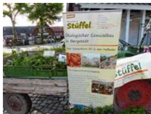
Der Gärtnerhof am Stüffel war Schauplatz des Sommerempfangs der IG Bergstedt – und auch mit einem Stand beim Feierabendmarkt vertreten