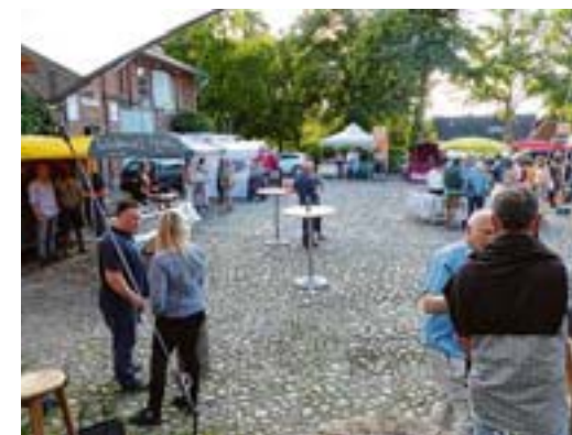
Am Ende einer Arbeitswoche ungezwungen zusammenkommen – diese Gelegenheit nahmen nicht nur Bergstedter wahr