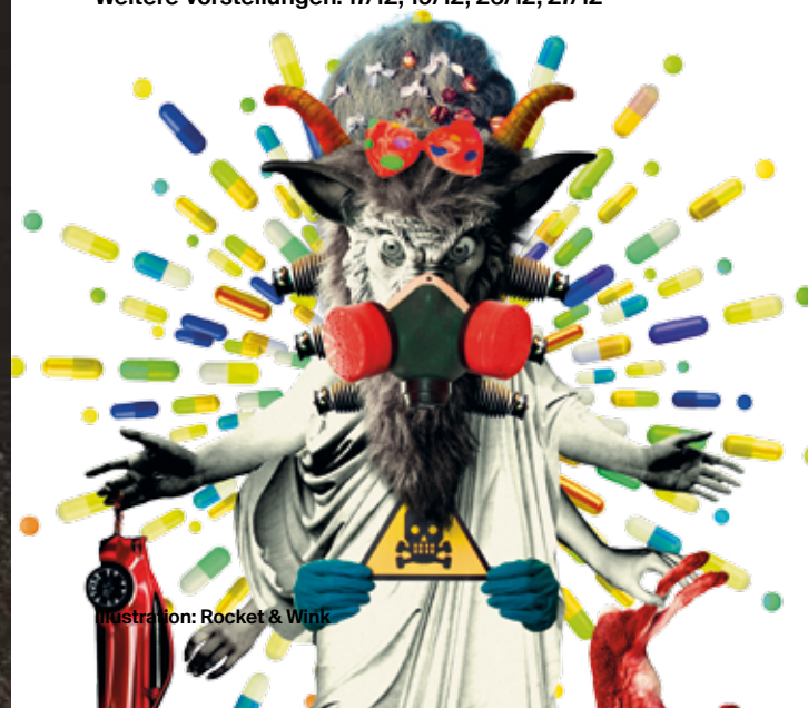
Illustration: Rocket & Wink

Uraufführung: 15/12/2018 / SchauSpielHaus Weitere Vorstellungen: 17/12, 19/12, 26/12, 27/12