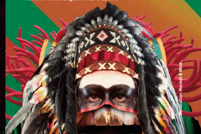
Illustration: Rocket & Wink

Premiere: 15/2/2019 / MalerSaal Weitere Vorstellungen: 16/2, 18/2, 21/2