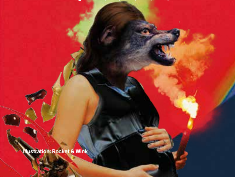
Illustration: Rocket & Wink

Premiere: 18/1/2019 / SchauSpielHaus Weitere Vorstellungen: 20/1, 21/1, 25/1, 27/2, 22/3, 13/4