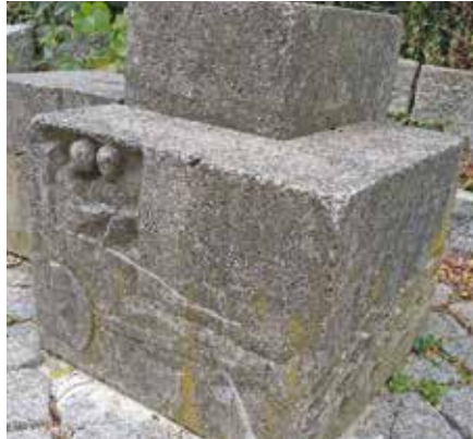
Die gesuchte Skulptur unterhalb des Turm-Plateaus

na Lehmann: „Hallo, liebe Redaktion vom Billstedter, hier kommt die Lösung zu diesem Rätsel: Die Skulptur