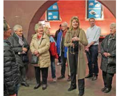
Im Allerheiligsten der Metal-Szene: Der ehemalige Wasserbunker ist heute Treffpunkt musikbegeisterter Jugendlicher aus ganz Europa