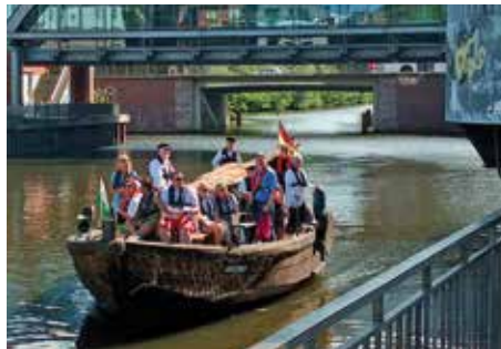
Ewer bei der Hafeneinfahrt

Eines der schönsten Angebote, nicht nur der Bergedorfer Museumslandschaft, sondern ganz Hamburgs, ist der monatlich stattfindende Museumstörn mit dem Vierländer Ewer. Früher transportierten Ewer die