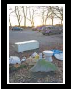
Idylle am Öjendorfer See

Schiet und Dreck fand DerBi kürzlich auch auf dem Süd-Parkplatz des Öjendorfer Parks. Ein gedanken- und gewissenloser Zeitgenosse entsorgte hier die Reste von Küche und Bad wie in einer der Müllkippen, in die die Firma Böhringer früher entsorgt hat. Was würde er wohl sagen, kippte man ihm den Schiet vor die Haustür? Der Parkplatz-Unrat war