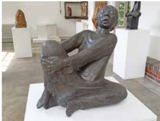
„Kunst ist eine Sache allertiefster Menschlichkeit...“ (Ernst Barlach, 1918)

Danach gehen wir weiter zum Stadthafen. Dort erwartet uns das Schiff nach Warnemünde. Die sehr attraktive Fahrt auf der Warnow und durch das Rostocker Hafengebiet dauert ca. 1 Stunde. Dann legen wir am Alten Strom in Rostocks berühmtem Seebad an. Hier kann nun jeder nach Herzenslust an der Seepromenade, in der Altstadt oder am ma-