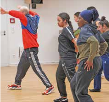
Spiegelsaal 1: Hier wird Dance gearbeitet...