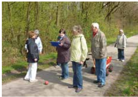
Boßeln in lauer Maienluft