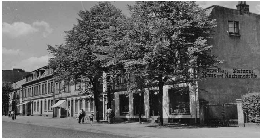
Wessen Laden ist hier abgebildet? Wo befand er sich?

NEU: Sie können Ihren gewonnenen Gutschein direkt in der Geschäftsstelle des Bürgervereins abholen. Jeweils in der Sprechstunde