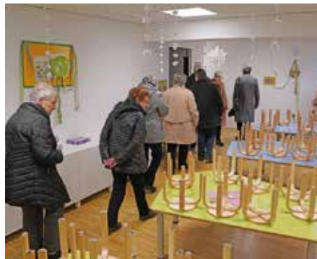
Wo die Klangstrolche zuhause sind: Die zweistöckige KiTa in den oberen Geschossen des Kulturpalastes:

Mit jährlich 350 Veranstaltungen und 470 Angeboten kultureller Bildung werden jährlich 260.000 Besucher angesprochen. Einen Schwerpunkt stellt die frühmusikalische