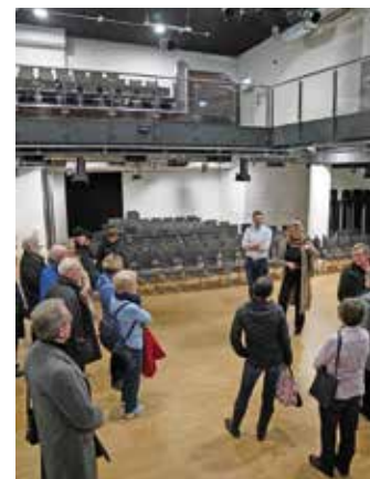
Die Erläuterungen der Chefs fanden ein aufmerksames Publikum

wurde – ganz naheliegend – noch ein Snack oder Drink in der Palastküche