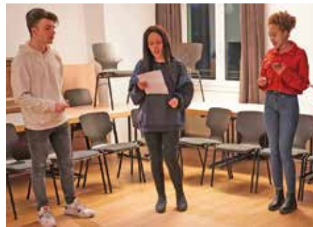
Grooviger Chor beim Songworkshop

ihre Bildungschancen zu verbessern. Für Kinder und Jugendliche werden schon sehr früh nachhaltige Zugänge zur Kultur und Bildung geschaffen. Durch eine positive Identifikation mit Bildung und Kultur werden ihnen bessere Bildungschancen und Perspektiven eröffnet.