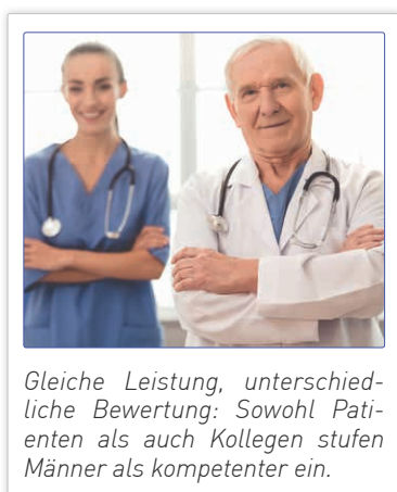
Gleiche Leistung, unterschiedliche Bewertung: Sowohl Patienten als auch Kollegen stufen Männer als kompetenter ein.

kompetenz durch Kollegen ihres jeweiligen Fachs schneiden die Frauen durchweg schlechter ab. Besonders deutlich ist dies bei den Humanmedizinerinnen zu erkennen: Dort erhielten mehr als doppelt so viele Männer hohe Bewertungen.