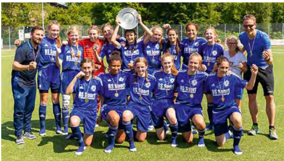
Die Meisterinnen der C-Mädchen feiern ihren Titel

D ie 1. C-Mädchen sind Meisterinnen der Verbandsliga in der Saison 2018/2019. Wie schon im Vorjahr, landete das Team am Saisonende auf Platz 1. Schlussendlich waren 42 Punkte auf dem Konto und damit sechs mehr als bei den Vizemeisterinnen vom Hamburger SV. Sagenhafte 73:17 Tore standen nach der letzten Partie zu Buche. Dieses Spiel vor heimischem Publikum brachte den 18. Saisonsieg ein. Mit 11:0 wurden die Mädchen des FC St. Pauli, die in Unterzahl spielen mussten und sich wacker der Aufgabe stellten, bezwungen.