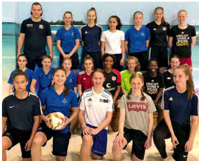
U16-Juniorinnen beim Beachsoccer

und freuen uns auf top motivierte Spielerinnen in der nächsten Saison.