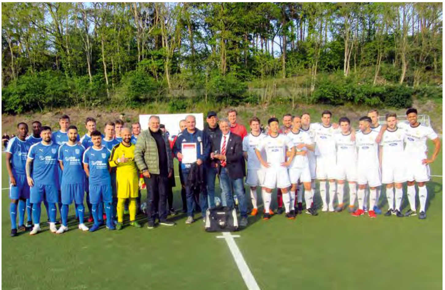
Ehrung vor dem Oberligaspiel FCS - SCC