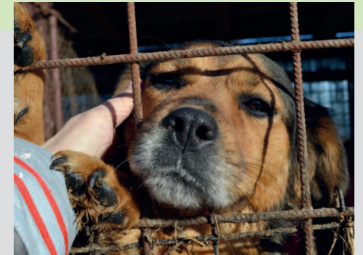
Wen würden Sie aussuchen für eine lebensrettende Fahrt nach Hamburg?