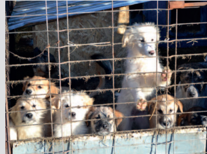
Junghunde im Hundelager Campina. Hoffentlich verbringen sie nicht ihre gesamte Jugend in dem engen Zwinger.