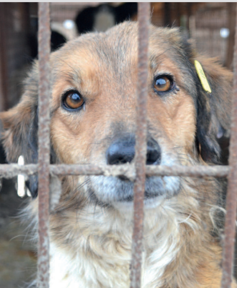
Die Hunde erzählen auf unterschiedliche Weise von ihrer Pein: Manche schreien in den höchsten Tönen ihr Leid raus, manche bellen gegen die Monotonie an – aber viele schauen auch nur, ganz gerade, ganz aufrichtig legen sie stumm ihre Wünsche in ihre Blicke. Für die, die verstehen.