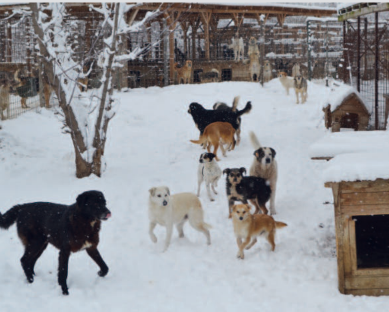
Die Hundelager im Winter zu erleben, hat neue Erkenntnisse gebracht. Hier sieht man einige der vielen frei auf dem Gelände lebenden Hunde, auch für sie braucht es Infrastruktur mit Futterstellen und Hütten.