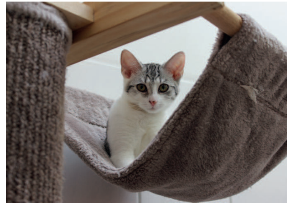
Hoch hinaus klettern die meisten Katzen gerne – von oben herab lässt sich die Welt so schön beobachten.

Wir können unsere Schützlinge bei uns im Tierheim in den verschiedenen Katzenräumen beobachten und bei der Vermittlung gut einschätzen, welche