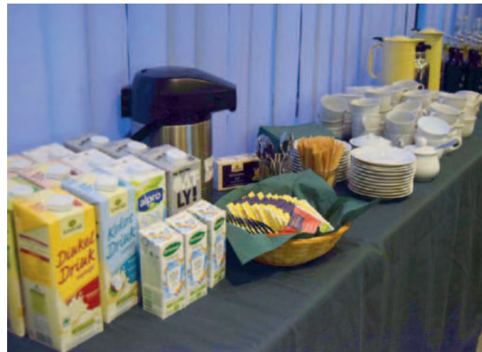
Die pflanzlichen Alternativen zu Kuhmilch sind vielseitig, wie der HTV zeigt.

Wie der Mensch und andere Säugetiere entwickelt die Kuh dann Milch, wenn sie ein Kind erwartet. Die Muttermilch, die als Nahrung für das Kälbchen gedacht ist, wird jedoch für den menschlichen Konsum geraubt. Um die Massennachfrage zu befriedigen, durchlaufen die Mütterkühe ab dem ersten Lebensjahr einen quälenden Kreislauf aus Zwangsbesamung, dem Entreißen ihrer Kälbchen – in der Regel direkt nach Geburt – sowie erneuter Zwangsbesamung. Die Kuh bekommt jedes