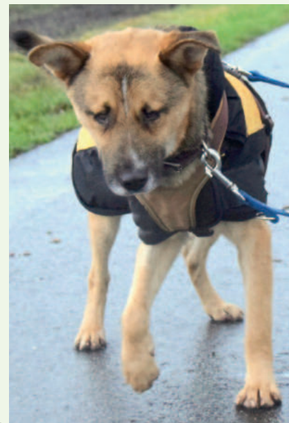
Trotz einiger Einschränkungen: Stevie genießt sein Hundeleben.

Die freundliche Hollie sucht noch ihre liebevolle Familie und freut sich auch über Patenschaften. Die Rumänin wirkt anfangs etwas skeptisch, taut aber schnell auf. Aufgrund eines alten Trümmerbruchs am Ellenbogen musste Hollies Vorderbein amputiert werden. Auf ihren drei Beinen kommt sie gut zurecht. Die Hündin lässt sich gerne streicheln und genießt Zuneigung. Hollie mag ihre Ruhe, erkundet aber auch neugierig die Gegend. Sie ist teilweise inkontinent, was wohl ebenfalls auf den Unfall in Rumänien zurückzuführen ist. Daher ist Hollie in besonderem Maß auf Hilfe angewiesen. Um diese Hilfe zu gewährleisten und die Suche nach einer Dauerpflegeeinrichtung zu erleichtern, können Sie sie mit einer Patenschaft unterstützen.