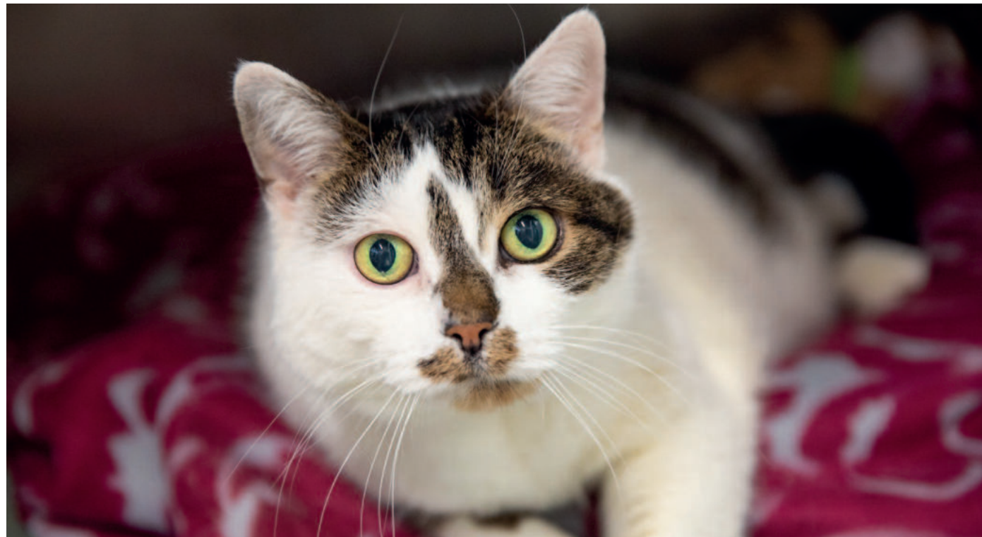
Die liebe Vreni ist eine verschmuste, etwa 14 Jahre alte Katzendame. Sie sucht ein ruhiges Zuhause, in dem sie sich rundum verwöhnt und umsorgt fühlen kann. Da Vreni an Diabetes leidet, benötigt sie zweimal am Tag pünktlich ihre Insulin-Spritze. Weil zudem ihre Bauchspeicheldrüse entzündet ist, kann der Schmusekatze nur Freigang auf einem gesicherten Balkon gewährt werden. Vreni ist kastriert und wartet mit der HTV-Nr. 33_A_19 bei uns im Alten Katzenhaus. Sie freut sich auch über Patinnen und Paten zur finanziellen Unterstützung ihrer Behandlung.

In den nächsten Wochen ist es wieder so weit: Die Frühjahrskätzchen werden geboren und damit steigt die Zahl der Katzen rasant an. Denn neben den vielen Samtpfoten, die geborgen in Sicherheit leben, gibt es in Hamburg mehr als 10.000 freilebende Katzen. 1.535 Katzen haben wir im vergangenen Jahr bei uns im Tierheim aufgenommen, darunter Fundtiere, Katzen aus behördlichen Sicherstellungen und Katzen, die von ihren Haltern abgegeben wurden. Mehr als 1.000 Katzen konnten wir in 2018 zu liebevollen Menschen vermitteln. Hier berichten wir, warum es so viele Katzen gibt, warum wir eine Kastrationspflicht fordern, wie wir freilebenden Katzen helfen – und wie auch Sie helfen können.