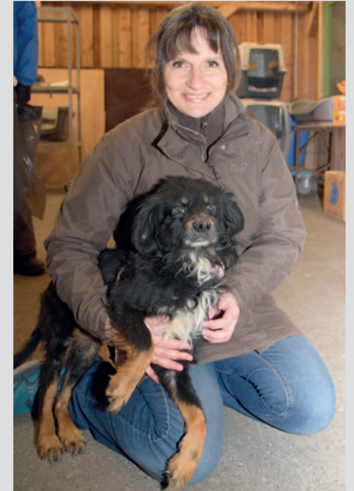
Janu ist sicher in Hamburg angekommen. Ich habe ihn nach dem Januar benannt, weil er mit Sicherheit den Februar im Hundelager nicht mehr erlebt hätte. Er war stark unterernährt und am Ende mit seinen Kräften. Aber als ich in seinen überfüllten Zwinger kam, hat er so laut geschrien, geschrien um sein bisschen vergehendes Leben, so dass ich ihn keinesfalls übersehen und zurücklassen konnte.