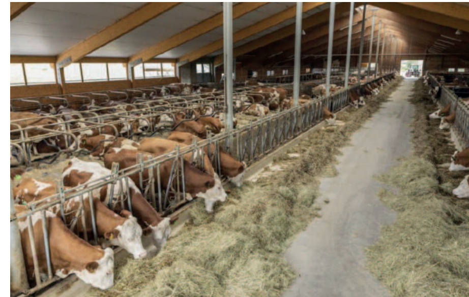
Ein Laufstall der „Premiumstufe“ bietet 6 m 2 Fläche pro Tier.

Die natürliche Lebensdauer einer Kuh beträgt je nach Rasse bis zu 30 Jahre, in der Industrie ist das sensible Säugetier nach etwa fünf Jahren ausgezehrt und wird geschlachtet. Eine bekannte Studie von Katharina Riehn et al. ergab, dass ca. zehn Prozent der jährlich in Deutschland geschlachteten Milchkühe trächtig sind – mehr als 100.000 Tiere. Sind es bereits lebensfähige Kälbchen, ersticken sie nach der Betäubung des Mutter-