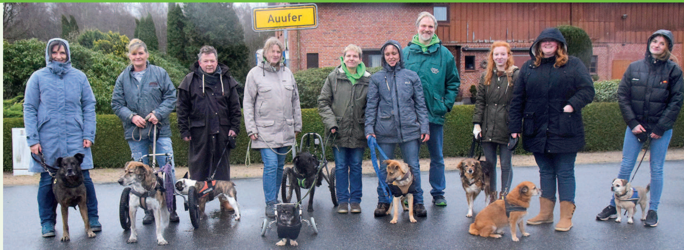
Tapfere Fellnasen bei unserem ersten Handicapchen-Treffen.