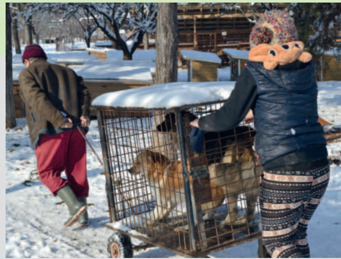
Ein so wichtiges Hilfsmittel sind die Hundewagen: Es ist kaum zu beschreiben, wie viel Angst und Schmerz den Hunden durch dieses Transportmittel erspart wird. Nur ganz wenige der Hunde können an der Leine laufen, so wurden sie früher an den Fangstangen über das Gelände geschleift – und heute fast stressfrei gefahren.