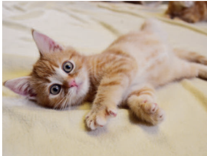
Um ungewollten Nachwuchs zu verhindern, auch Hauskatzen kastrieren lassen!

Geschlechtsreife, unkastrierte Kater markieren ihr Revier. Können sie ihrem Fortpflanzungstrieb nicht nachkommen, wird ein frustrierter Wohnungskater sich an Fußboden und Einrichtungsgegenständen auslassen und diese auch markieren. Und selbst wenn er nur die Katzentoilette benutzt, ist der Uringерuch eines unkastrierten Katers penetrant – und lässt sich von Holzböden und -möbeln schwer bis gar nicht entfernen.