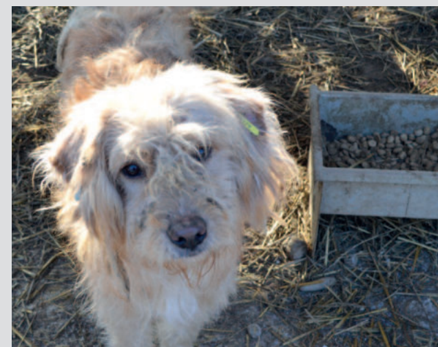
Langes Fell ist eine schlechte Voraussetzung für ein Lagerleben. Fellpflege – hier, wo es ums Überleben geht – ein unmöglicher Luxus.