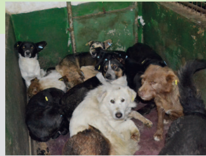
Die Vetkennel brauchen weiter dringend Verbesserungen. Sie sind aber nach wie vor der einzige Ort, an dem die Hunde in Bucov geschützt untergebracht werden können. Daneben gibt es nur Container, in denen kranke Hunde in Käfigen gehalten werden.