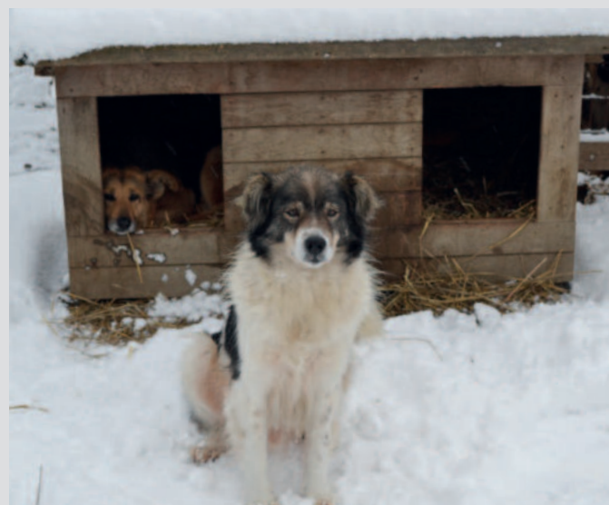
So viele starke, tolle Persönlichkeiten begegnen mir hier.