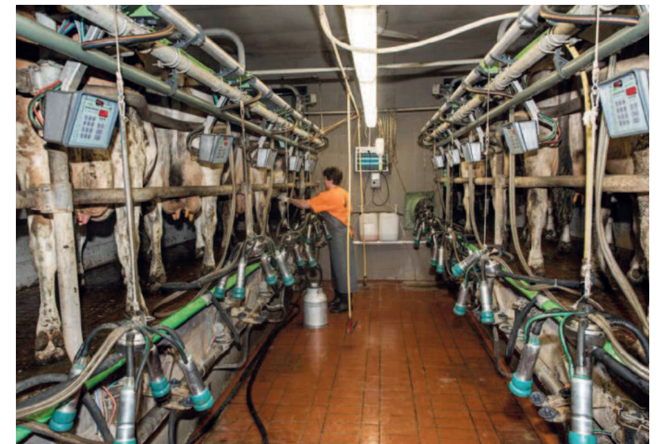
Industrielle Massenabfertigung: Milchkühe in einer Melkanlage.

Ende 2018 wurden in Deutschland 2,47 Mio. Kälber industriell gehalten. Sie werden häufig direkt nach der Geburt oder wenige Stunden später von ihrer Mutter getrennt. Die lebenslange enge Bindung und das monatelange Säugen durch die Mutter wird den Kälbchen verwehrt. In der Milchwirtschaft verbringen die weiblichen Kälber ihre ersten Lebenswochen in einer Box. Die männlichen Kälber der sogenannten Milchrasen sind für die Milchindustrie hingegen wertlos. Ihre Mast ist nach rein wirtschaftlichen Kriterien nicht rentabel – daher werden die Tierkinder geschlachtet.