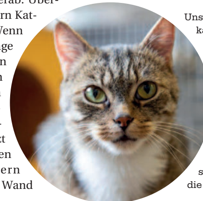
Unser fünf Jahre alter, kastrierter Titelterkater Jupp kam als Fundtier zu uns ins Tierheim. Der selbstbewusste, liebe Kerl kennt Artgenossen ist stubenrein - und seine Flohspeichelallergie ist mit Medikamenten im Griff. Wenn er getreidefreies Futter bekommt und nach draußen kann, geht es dem zierlichen Kater gut. Jupp wartet mit der HTV-Nummer 7176_F_18 im Neuen Katzenhaus und freut sich auch über Patinnen und Paten, die ihm sein Spezialfutter finanzieren.

haupt klettern Katzen gerne: Wenn die Vorhänge heil bleiben sollen, kann man ein Kletterparadies aus leeren, versetzt angeordneten Regalbrettern an der Wand