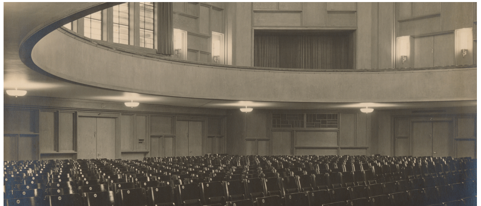
Saal der Friedrich-Ebert-Halle, 1930.

Eintritt: 6 Euro, ermäßigt 4 Euro, bis 17 Jahre frei. Archäologisches Museum Hamburg, Harburger Rathausplatz 5, 21073 Hamburg Öffnungszeiten: Di–So 10–17 Uhr Mitglieder des Museumsvereins haben freien Eintritt.