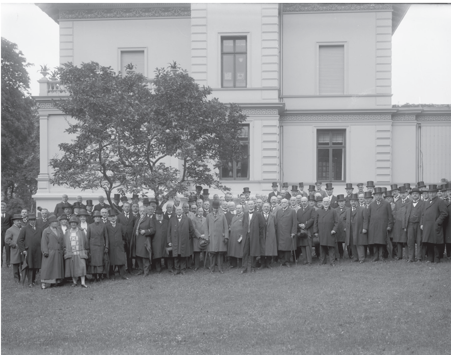
Der Museumsverein bei der Einweihung des Helms-Museums 1925 vor der Villa an der Buxtehuder Straße.