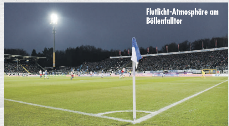
Flutlicht-Atmosphäre am Böllenfalltor