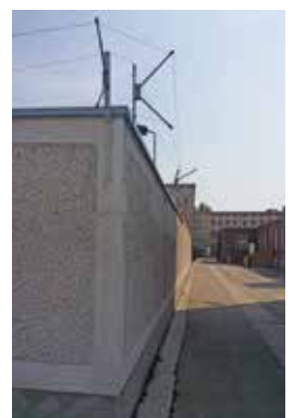
Grauer Ort mit beklemmender Vergangenheit: Stasi-Gefängnis „Hohenschönhausen“