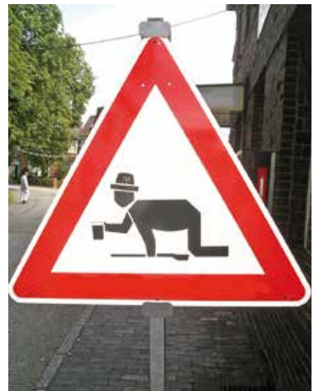
Verkehrszeichen „Kriechgang“

Die originellste Antwort gewinnt den Braten!