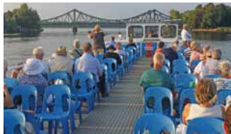
Stimmungsvolle Abendfahrt über den Wannsee – im Vordergrund die berühmt-berüchtigte Glienicker Brücke

Der „Telespargel“ am Alexanderplatz gefiel mit guter Aussicht (360 Grad Umdrehung in einer halben Stunde) und gutem Essen!