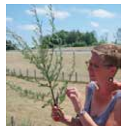
Beifuß, das Gewürz zum Gänsebraten...