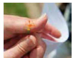
Saft des Schöllkrauts: Giftig, aber wirksam bei richtiger Anwendung