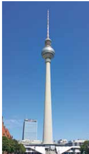
Der „Telespargel“ am Alexanderplatz gefiel mit guter Aussicht (360 Grad Umdrehung in einer halben Stunde) und gutem Essen!

den Parks auszubauen und zu sanieren. Damit war dem MdB der Beifall