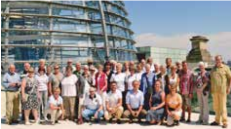
Gruppenfoto mit eigenem Bundestagsabgeordnetem...

Vom 30. Juli bis zum 1. August fand unsere Fahrt nach Berlin mit Johannes Kahrs, MdB, statt. Etwa 20 Mitglieder des Bürgervereins nutzten das günstige Angebot des Presse- und Informationsamts der Bundesregierung, um etwas von der Arbeit