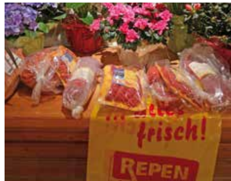
Große Auswahl schöner Tombola-Preise