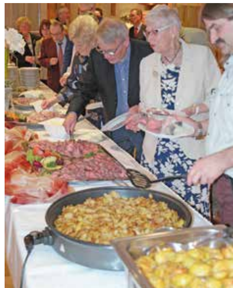
Das Büfett fand großen Zuspruch...