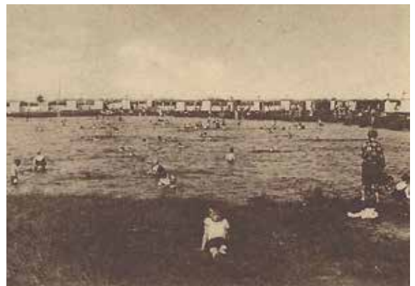
Welches Badegewässer ist hier abgebildet?

Gewässer ist hier abgebildet? Wo befand es sich und wie hieß oder heißt es? Auch dieses Mal gibt es zwei Warengutscheine zu gewinnen. Einen in Höhe von 25 Euro von der Fleischerei Peters , Möllner Landstraße 229 UND einen Warengutschein in Höhe von 25 Euro vom Blumenhaus Reimann , Kapellenstraße 90.