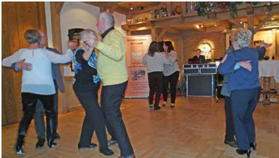
Kalorien wurden gleich in Bewegung umgesetzt