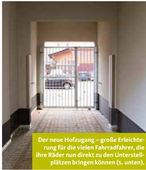
Der neue Hofzugang – große Erleichterung für die vielen Fahrradfahrer, die ihre Räder nun direkt zu den Unterstellplätzen bringen können (s. unten).