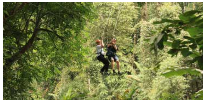
Durch die Baumwipfel des Dschungels schweben – einmaliges Erlebnis in 60 Metern Höhe.

Thailand ist ein Land, das man entweder liebt oder hasst, ein Dazwischen gibt es nicht. Hier trifft westliche Kultur (in den Großstädten und Tourismuszentren) auf Ursprünglichkeit, Einfachheit und vor allem Zufriedenheit. Das macht den Charme des Landes und dessen Bewohner besonders. Wir lieben Thailand!