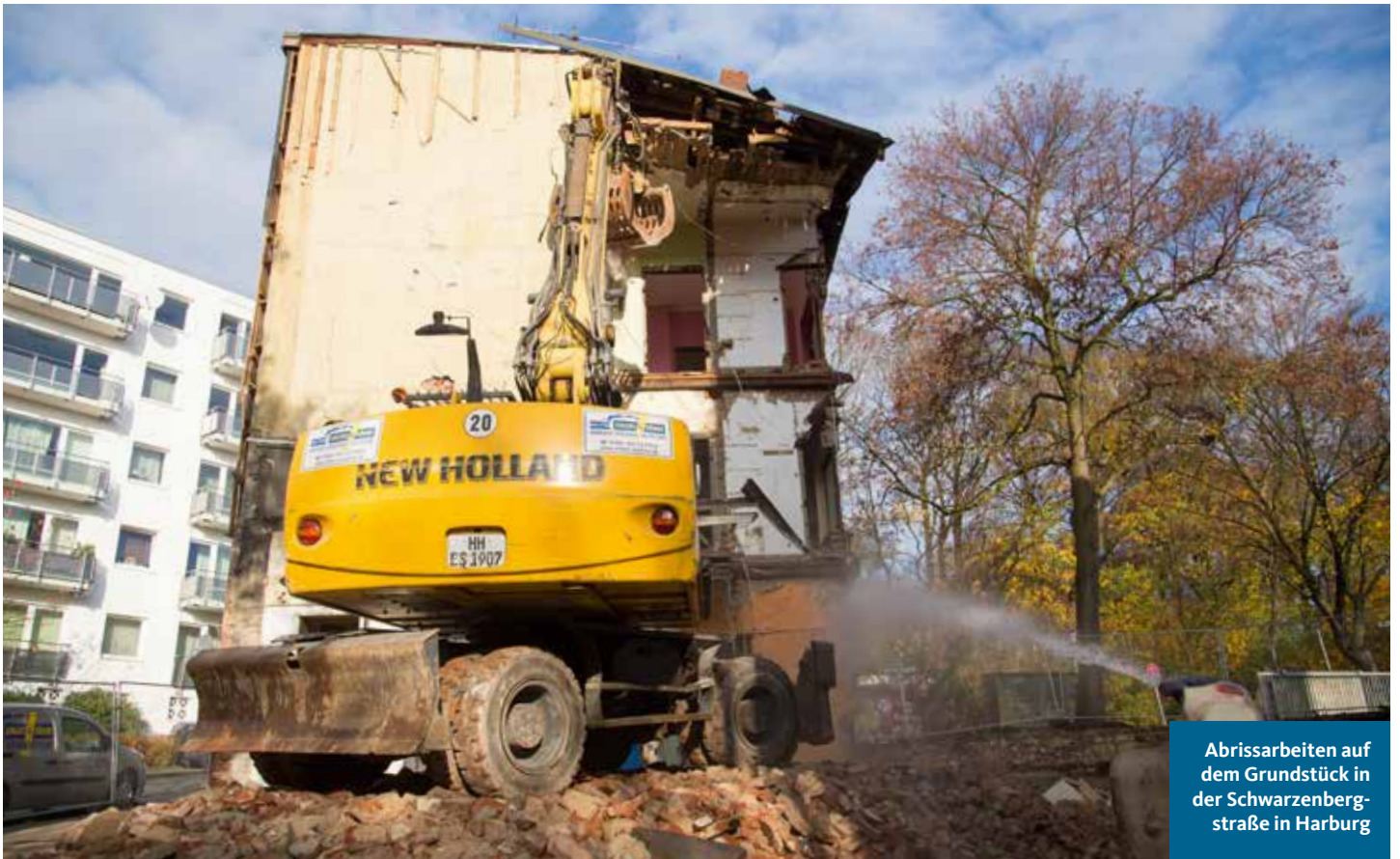
Abrissarbeiten auf dem Grundstück in der Schwarzenbergstraße in Harburg