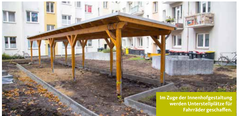
Im Zuge der Innenhofgestaltung werden Unterstellplätze für Fahrräder geschaffen.

Nach dem Umbau des Ladengeschäftes in der Fährstraße 73 und der Schaffung der Tordurchfahrt wird zurzeit der Innenhof des gesamten Wohnquartiers umgestaltet. Wenn die Witterung es zulässt, werden die Arbeiten voraussichtlich zum Jahresende abgeschlossen sein. Änderungen bei der Gestaltungsplanung hat sich der BAUVEREIN noch vorbehalten. In Zusammenarbeit mit interessierten Mitgliedern werden im kommenden Frühjahr die Hochbeete gepflanzt.