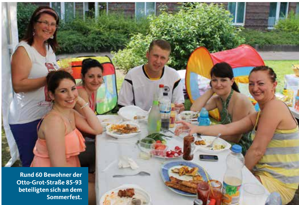
Rund 60 Bewohner der Otto-Grot-Straße 85-93 beteiligten sich an dem Sommerfest.