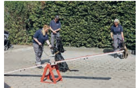
Die Hundestaffel der DRK Altona

Auch das Kasperletheater war wieder gut besucht, und mit Begeisterung kam es zum Dialog mit Kasperle und Kumpanen. Höhepunkt war die Vorführung