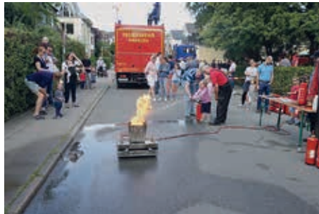
Die Kleinen bei der Löschübung

Bei der Firma Mini Max konnte eine große Flamme mit einem mit Wasser gefüllten Feuerlöscher gelöscht werden. So führt man die Kinder schon früh an den Gebrauch