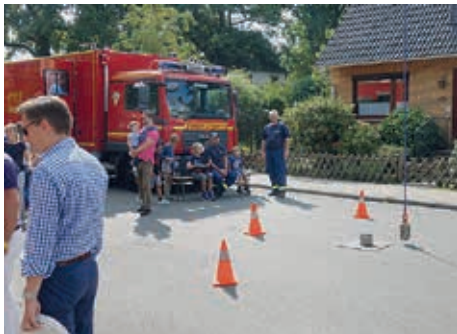
Kran des THW

Es wurde wie immer wieder viel geboten, vor allem für die Kleinen. Die Löschfahrzeuge wurden präsentiert und als besondere Attraktion der Kranwagen des THW. Hier konnten die Kinder versuchen, mit Hilfe einer Fernbedienung ein Gewicht in eine Hülse einzubringen. Dass macht mehr Spaß als jedes Computerspiel.