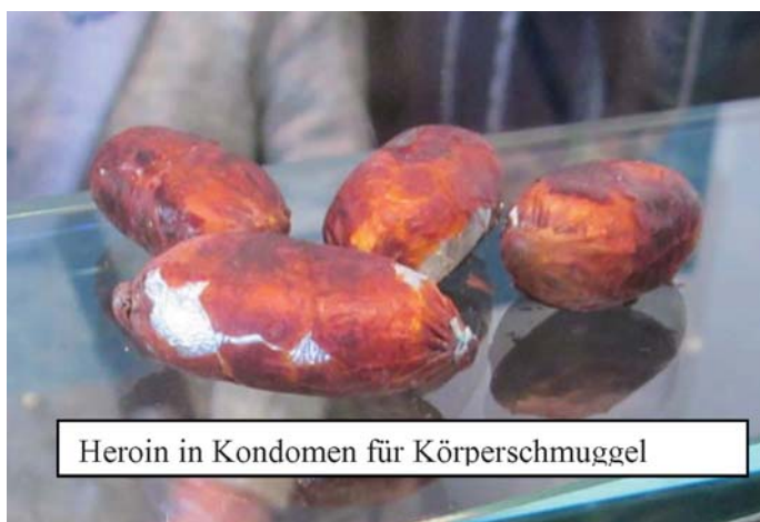
Heroin in Kondomen für Körperschmuggel