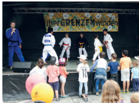
Der BSV präsentierte die Karate-Abteilung

Garniert wurde der verkaufsoffene Sonntag von einigen besonderen Angeboten: So gab es bei neovii einen Beilagensalat zu jedem Nudelgericht umsonst, BR Spielwaren überraschte mit 20 Prozent auf das Hama-Sortiment und einer Hamaperlen-Bastelaktion, bei Hagel gab es 20 Prozent Preisnachlass auf alle Verkaufsprodukte,