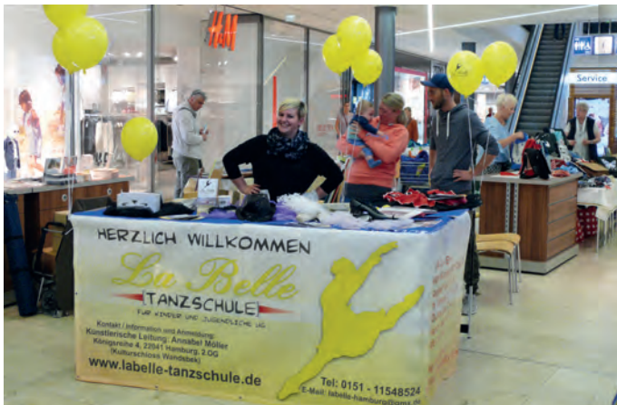
Alle Aussteller freuten sich auf die Kulturbörse in der Marktplatz Galerie