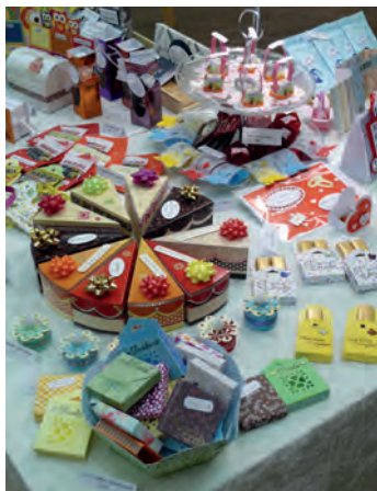
Kunsthandwerk par excellence