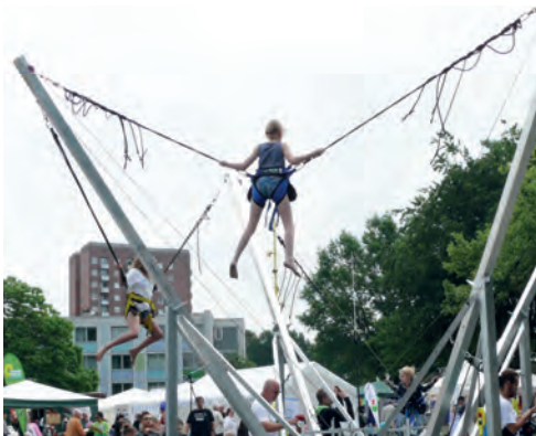
Viel Spaß für die Kleinen beim Bungee-Springen

Es war ein richtig bunter und unterhaltsamer Erlebnis-Sonntag: Am 3. Juni feierte Bramfeld sein mittlerweile 28. Stadtteilstfest (veranstaltet von der Kinder- und Jugend AG Bramfeld) auf dem Marktplatz Herthastraße und natürlich mischt das