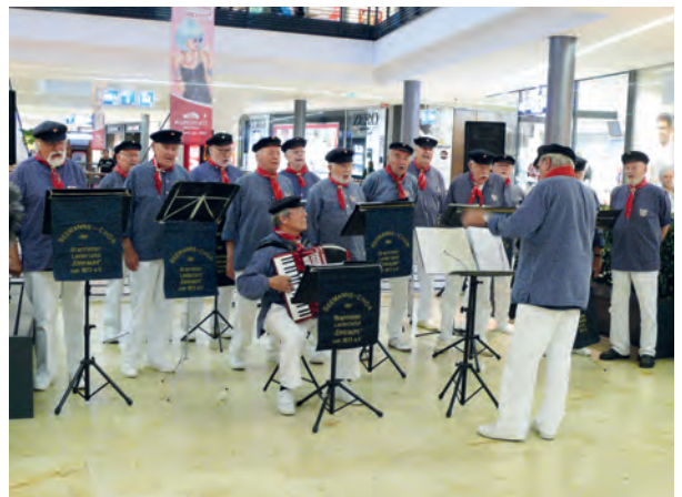
Der Seemannschor der Bramfelder Liedertafel von 1873