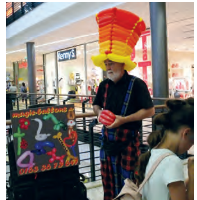
In der Marktplatz-Galerie wurden die Kleinen vom Ballonkünstler verzaubert

Alle freuten sich also auf einen kunterbunten Festtag - ganz im Zeichen des Mit- und Füreinanders!