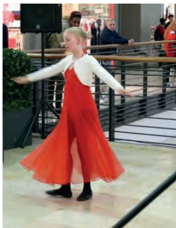
Die Solotänzerinnen von LaBelle (l.) und der Ballett-Gruppe des BSV (r.)