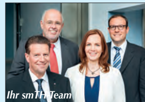
Ihr smTH Team