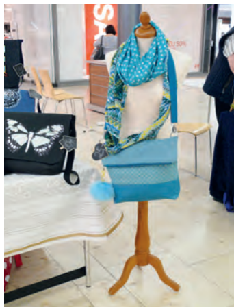
Tolle selbstgemachte Taschen