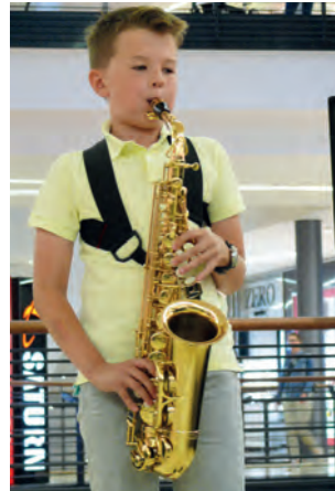
Tolle Einzelleistungen der SchülerInnen vom Hamburger Musikum