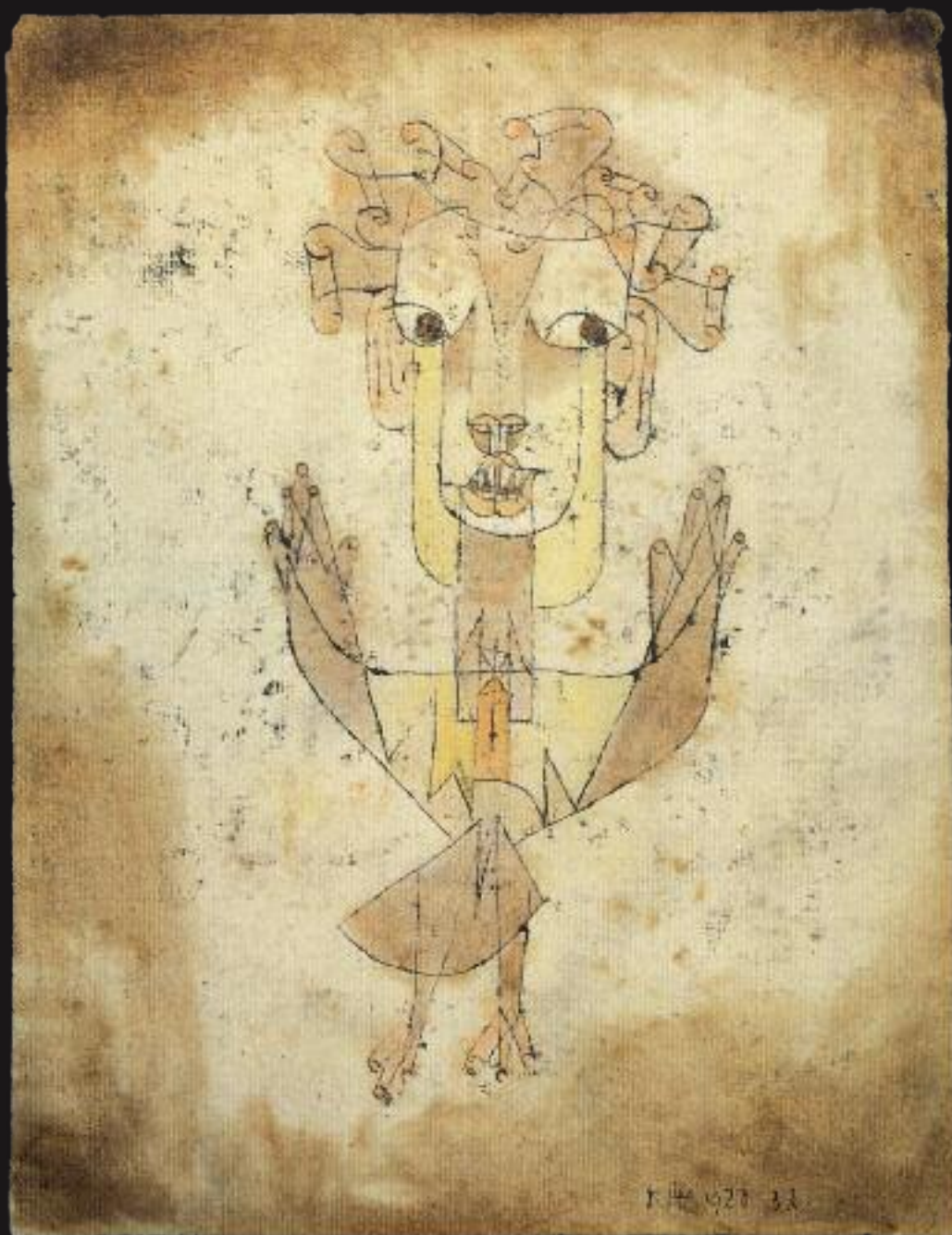
„Angelus Novus“ (lat.: Neuer Engel). Paul Klee, 1920. Ölpaüse und Aquarell auf Papier und Karton, 318 x 242mm.

Walter Benjamin erwarb das Bild 1921. Es hing in seiner Wohnung und wurde ihm, als er Berlin 1933 verlassen musste, 1935 nach Paris ins Exil gebracht. Dort hatte er es bei sich bis zu seiner Flucht Richtung Spanien. George Bataille versteckte das Bild zusammen mit Schriften Benjamins in der Pariser Bibliothèque nationale. Nach Ende des II. Weltkriegs gingen diese geretteten Besitztümer Benjamins zunächst zu Theodor W. Adorno nach New York, der das Bild des „Angelus Novus“ dann Gershom Scholem übergab, wie Benjamin es in seinem Testament verfügt hatte. Seit 1989 hängt es im Israel Museum in Jerusalem.