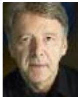
Peter Ruzicka (Komposition und Musikalische Leitung)

erhielt für seine Kompositionen zahlreiche Preise und Auszeichnungen. Seine Werke werden von führenden Orchestern und Ensembles aufgeführt. Seine Oper CELAN erlebte 2001 ihre Uraufführung an der Dresdner Semperoper, sein Musiktheater HÖLDERLIN wurde 2008 an der Staatsoper Unter den Linden Berlin uraufgeführt. Von 1988 bis 1997 war Peter Ruzicka Intendant der Staatsoper Hamburg und des Philharmonischen Staatsorchesters. 1996 übernahm er die künstlerische Leitung der Münchener Biennale, die er bis 2014 innehatte. Von 2002 bis 2006 übernahm er die künstlerische Leitung der Salzburger Festspiele. Ab 2015 leitet er als Geschäftsführender Intendant die Osterfestspiele Salzburg. Als Dirigent ist er regelmäßig bei den wichtigen Orchestern Europas zu Gast. Beim Philharmonischen Staatsorchester dirigierte er kürzlich das 3. Philharmonische Konzert.