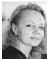
Heike Vollmer (Bühnenbild)

2006/07 Chefdirigent des Belgrader Nationaltheaters. Harnleit erhielt zahlreiche Kompositionsaufträge, u. a. von der Hamburgischen Staatsoper, der Alten Oper Frankfurt, den Stuttgarter Philharmonikern und dem Ensemble Scharoun.