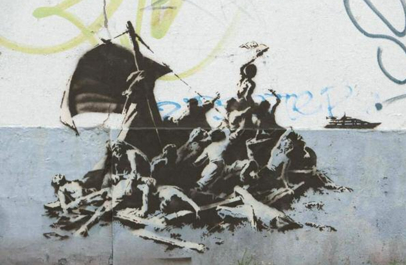
Banksy-Graffiti in Calais

Klar war und ist bis heute: auf dem Meer herrschen andere Regeln. Es gibt keine nationalen Hoheiten, und welche Gesellschaftstheorien ein Kapitän im 18. oder 19. Jahrhundert seinem Führungsstil zugrunde legte, konnte er recht frei wählen. Auch musste manch existenzielle Entscheidung schnell zur Hand sein, was dem Wert eines einzelnen Menschenlebens bisweilen abträglich sein konnte. Trotz dieser beträchtlichen Willkür – und neben der gängigen Praxis mancher Kapitäne, bei Bedarf ihre Besatzung auch gewaltsam zu rekrutieren (Alkohol war da ein gern gesehener Helfer) – begaben sich Menschen auch freiwillig auf See. Das hatte zum einen ganz existenzielle Gründe: in Europa stand die gesellschaftliche Ungleichheit in höchster Blüte, und religiöse Verfolgungen machten für manche das Leben an Land unmöglich; zudem bot der zahlenmäßig kleine Rahmen einer Schiffscrew eine potenzielle Handlungsfähigkeit in Bezug auf gesellschaftliche Unzufriedenheiten: gegen einen Kapitän war schneller gemeutert als ein König an Land gestürzt. Den privilegierten Europäern wiederum versprach die kolonialistische Seefahrt ein Paradies an Reichtum und Macht, dessen Äpfel bis heute geerntet werden.