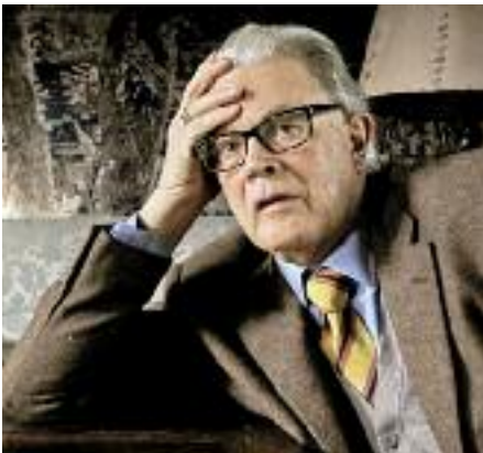
Kent Nagano Enoch zu Guttenberg