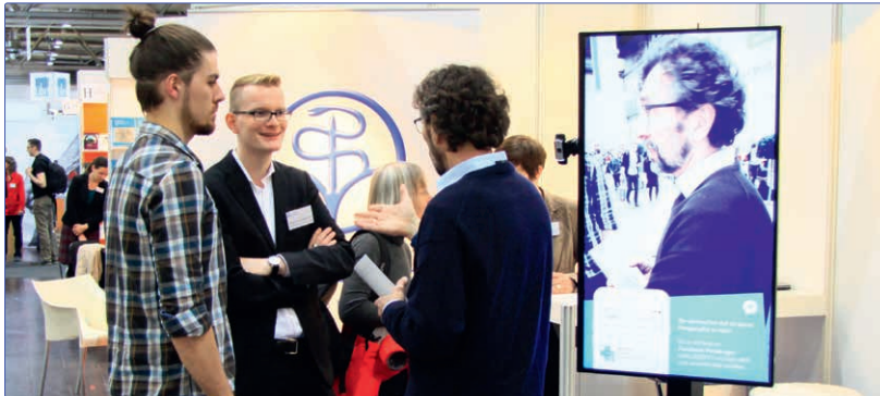
Reges Treiben am Messestand der Stiftung: Verlage, Buchhändler und Leser informieren sich über das evidenzbasierte Prüfsystem für gesundheitsbezogene Printratgeber, Websites, Hörbücher und DVDs.

Stiftung präsentiert Zertifizierungssystem auf der Leipziger Buchmesse