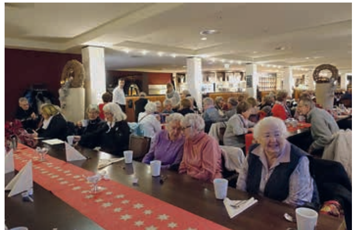
Kaffee und Kuchen im Alsterhaus (SL)

Verführerisch gelockt, sanft gepflegt, pfiffig geschnitten