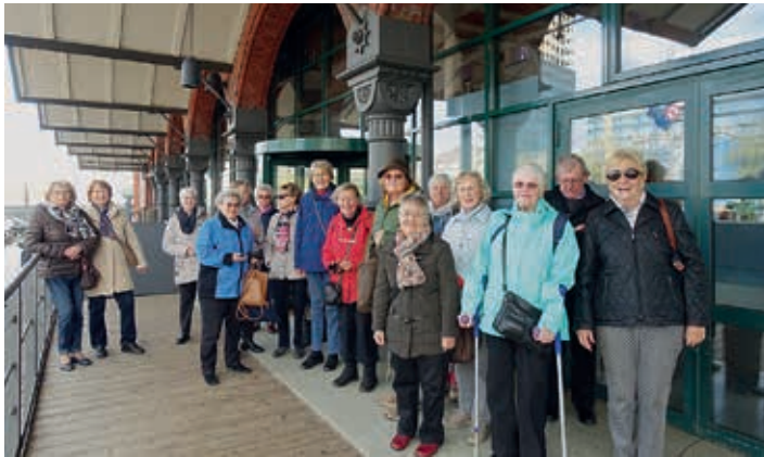
BAK vor dem Eingang zum Zollmuseum

der alte Zollkreuzer „Oldenburg“, der für alle BesucherInnen zugänglich im Zollkanal vor dem Museum liegt. Leider wurde die von mir gebuchte Führung kurzfristig abgesagt, doch auch ohne eine Führung ist die Ausstellung