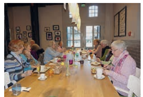
BAK im Bistro „Catch of the day“