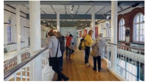
BAK im Zollmuseum

800 m 2 Ausstellungsfläche, wo die Zollgeschichte vom Altertum bis zur Gegenwart anschaulich präsentiert wird. Die Dauerausstellung bietet allen Generationen spannende Schmuggelgeschichten und Informationen zum Thema Zoll anhand von über 1.000 Exponaten, Grafiken, interaktiven Elementen sowie Film- und Hörstationen. Lebendige Geschichte vermittelt nicht zuletzt