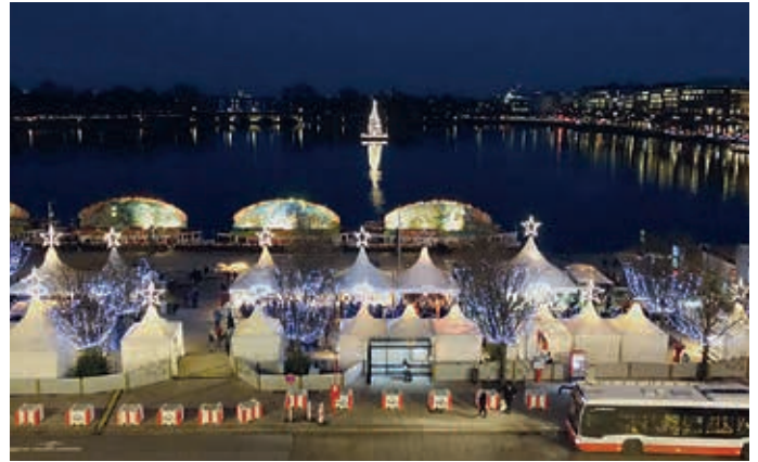
Ausblick vom Alsterhaus-Kaffee auf Jungfernstieg und Binnenalster