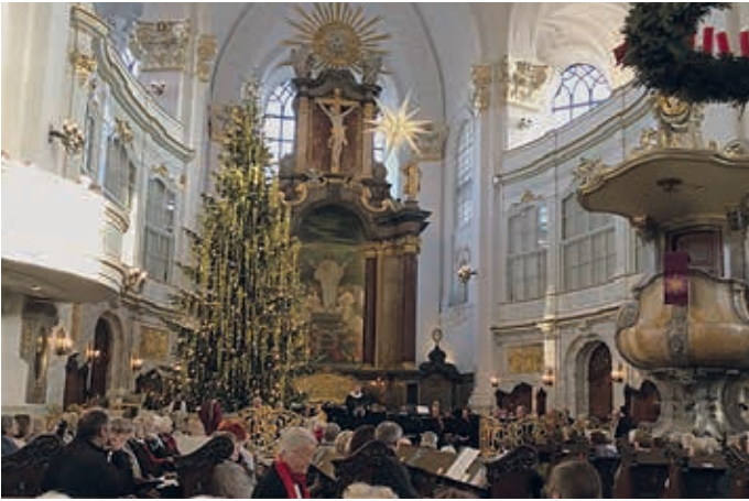
Eröffnung Lucia-Konzert im Michel (GL)