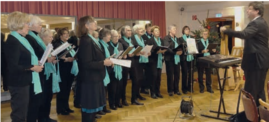
Volksdorfer Chor in Aktion