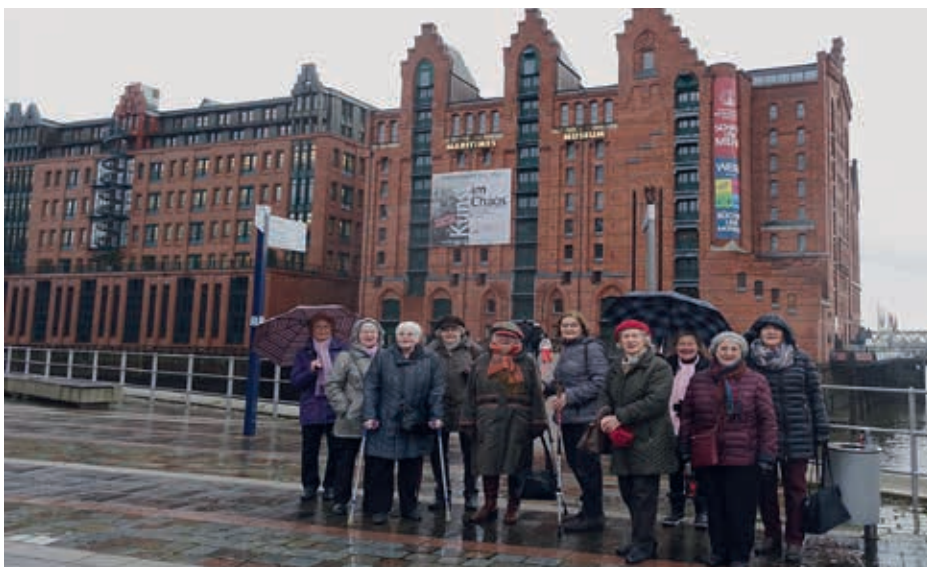
BAK vor dem IMMH

Nach dem interessanten Rundgang trafen wir uns unten im Bistro „Catch of the day“ an einem großen, für uns reservierten, Tisch und plauderten bei Kaffee, Tee, Kuchen und leckeren kleinen Speisen, bevor wir die Heimfahrt Richtung Volksdorf antraten. Es war wieder ein wunderschöner Ausflug mit unserer netten Gruppe! (EL)