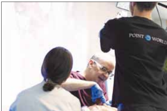
Zwei-Tages-Kurs mit Live-Behandlung mit Piet Troost

Vom 9.-10. November 2018 ist es wieder soweit: der renommierte Zahnarzt und Zahnarzt-Trainer Piet Troost