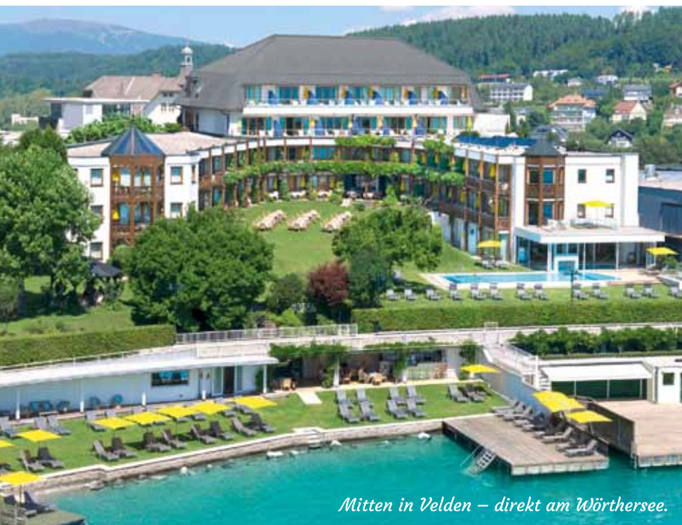
Mitten in Velden – direkt am Wörthersee.

Soweit Sie auf fremde Seiten verlinken, sollten Sie auch einen Ausschluss der Haftung für Links aufnehmen. For-