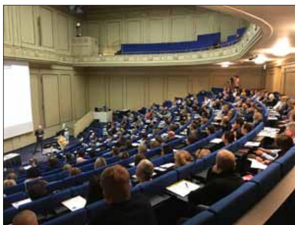
Ein gut gefülltes Auditorium hörte interessiert den Vorträgen zu

Sie stellten sich den neugierigen Fragen des Publikums und konnten erste Einblicke in die noch unveröffent-