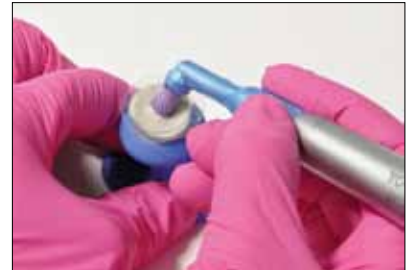
Praktische Einzeldosis und gratis Fingerhalter.

Zu den Inhaltsstoffen gehört der Zuckersersatz Xylitol, er vermindert die Bildung von zahnschädigenden Säuren und Plaque und hat einen kariostatischen Effekt. Ein weiterer Bestandteil ist Natron, das die Reinigungszeit verkürzt und die Zahnaufhellung fördert. Darüber hinaus verbessert es die Pufferkapazität des Speichels und beseitigt schädliche Mikroorganismen