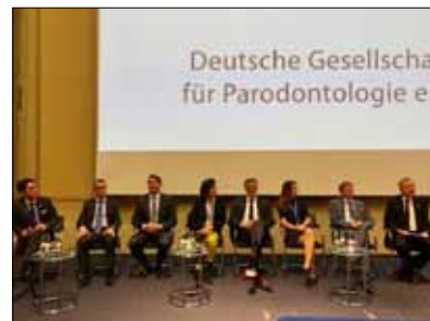
Podiumsdiskussion über die Relevanz der neuen Klassifikation

geschlossen ist, konnte die Tagung allen Teilnehmerinnen und Teilnehmern bereits einen umfangreichen Einblick in die Diskussion und damit auch einen Ausblick hinsichtlich der voraussichtlichen Änderungen geben. Die Mischung aus aktuellen Forschungsergebnissen und Umsetzung im Praxisalltag war nicht zuletzt durch die Auswahl der Referenten sehr gelungen, sodass jeder Teilnehmer für sich etwas Entscheidendes extrahieren konnte und mit Spannung die neue Klassifikation erwarten kann.