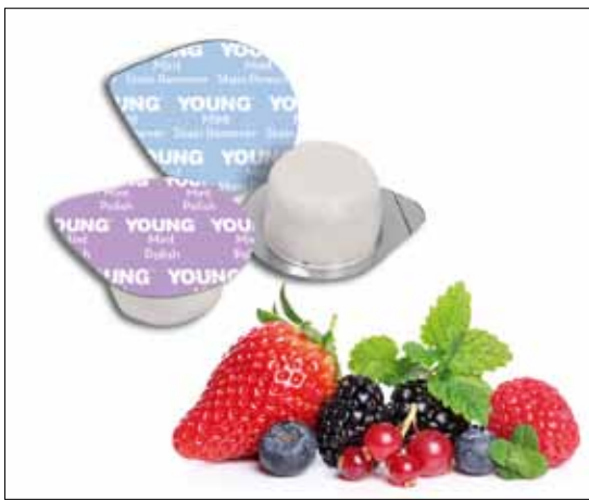
Die neuen Propy Pasten von Young Dental.

Sie beseitigen Verfärbungen, erzielen eine deutliche Zahnaufhellung und überzeugen mit bemerkenswerter Effizienz. Dabei wirken sie weniger abrasiv als vergleichbare Produkte und sind darüber hinaus vegan, zucker-, laktose- und glutenfrei.