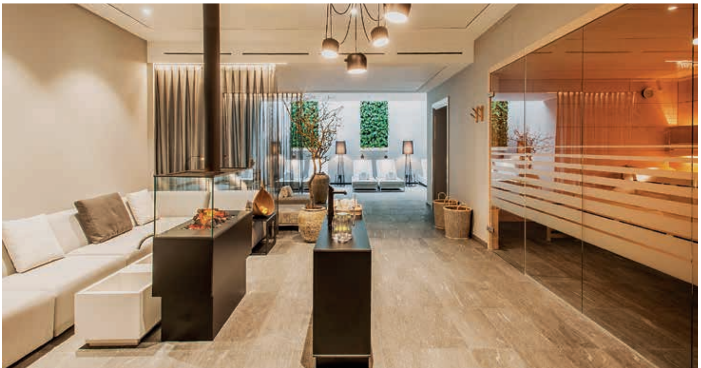
Der neue Wellness-Bereich