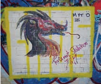
Kunst am Tunnel

Eine Bitte: Wer hat weitere Informationen, Fotos, Aufzeichnungen etc. vom Tunnel ?