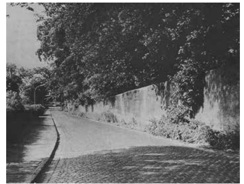
Mauer entlang der Elbschlossstraße

Mit der Zeit verwilderte der einst so prächtige Park mit dem Herrenhaus und den übrigen Gebäuden. Der