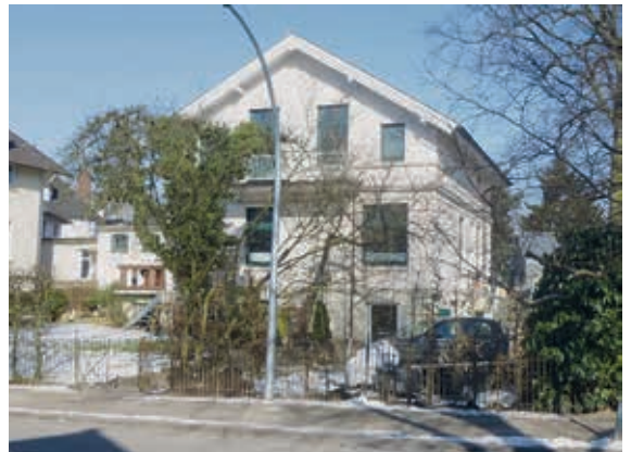
Bild 3. 112 Jahre später, die Oberleitungsmasten der „Elektrischen“ fehlen. Bald werden vor dem Haus der Firma „Sanitärtechnik Bruno Wernicke“ an der Ecke Rupertistraße-Up de Schanz wieder die Mandelbäume blühen. Uns Döörp hett Traditschoon.