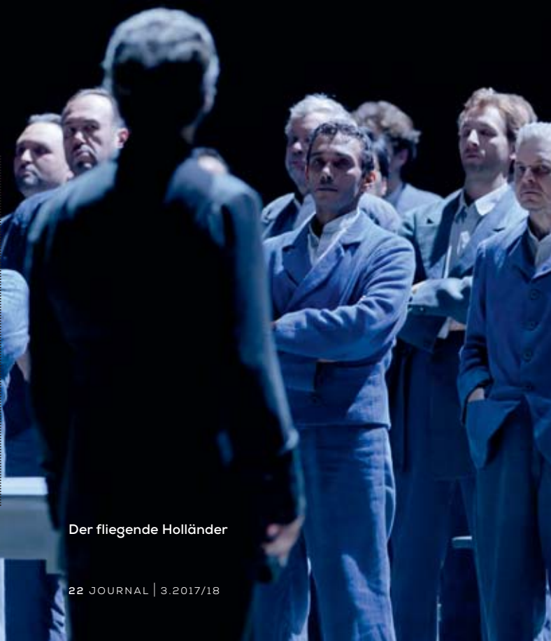
Der fliegende Holländer