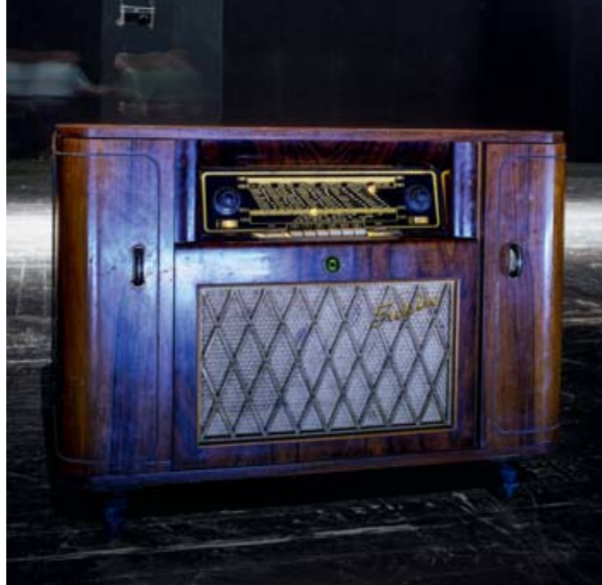
Unser Titelfoto: Neben „Caruso“, „Cosima“ und „Arabella“ trug eine „Konzertschrank“-Serie der Firma Nordmende aus den späten 50er Jahren den Namen „Fidelio“, wenige Jahre nach Kriegsende und Befreiung vom Nazi-Regime. Ein solches Radio ist Teil des Fidelio -Bühnenbildes.