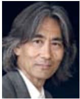
Kent Nagano (Musikalische Leitung)

gilt weltweit als einer der herausragenden Opern- und Konzertdirigenten. Er war Musikdirektor des Berkeley Symphony Orchestra, der Opéra National de Lyon, des Hallé Orchestra und der Los Angeles Opera sowie künstlerischer Leiter und Chefdirigent des Deutschen Symphonieorchesters Berlin. Von 2006 bis 2013 war er Generalmusikdirektor der Bayerischen Staatsoper. Seit 2006 ist Kent Nagano zudem Musikdirektor des Orchestre Symphonique de Montréal, seit 2013 auch Erster Gastdirigent der Göteborger Symphoniker. Er gastiert regelmäßig in allen wichtigen Musikmetropolen. Seit 2015/16 hat der aus Kalifornien stammende Dirigent das Amt des Hamburgischen Generalmusikdirektors inne.