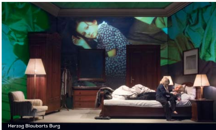
Herzog Blaubarts Burg