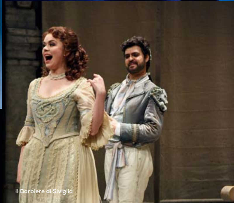
Il Barbiere di Siviglia