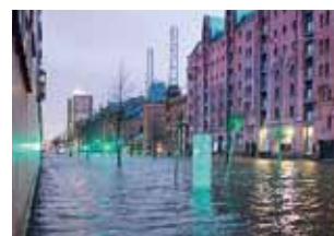
Die Straße Am Sandtorkai am Morgen des 6. Dezember 2013