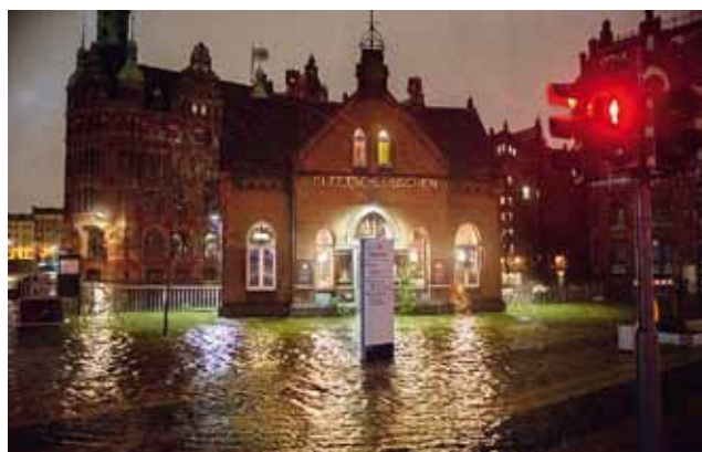
Der höchste Wasserstand in Hamburg seit der Sturmflut von 1976 setzte die Speicherstadt vollständig unter Wasser.