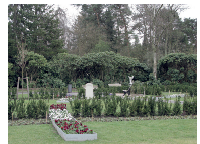
Anlage „Am Blumenband“ (Pressefoto)

Start der Busrundfahrt auf der Friedhofsseite des Verwaltungsgebäudes, Fuhlsbüttler Straße 756. Dauer der Busrundfahrt ca. 2 Stunden. Die Busfahrten sind kostenlos. Eine Anmeldung unter Telefon 593 88 -0 oder per Mail unter rundfahrt@friedhof-hamburg.de ist erforderlich.