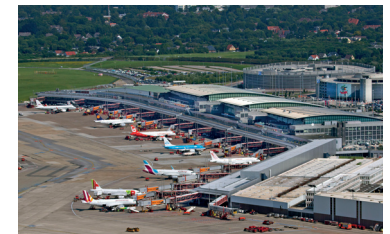
Flughafen Hamburg, Terminals, Vorfeld, Parkhäuser

Im Jahr 2015 nutzten 15,61 Millionen Fluggäste Hamburg Airport (2014: 14,76 Millionen Fluggäste). Das ist ein Plus von 5,8 Prozent und ein neuer Passagierrekord für den Flughafen. Die Zahl der Starts und Landungen stieg geringer als die Passagierzahl. Im Streckennetz wurden elf neue Ziele ab Hamburg Airport angefliegen.