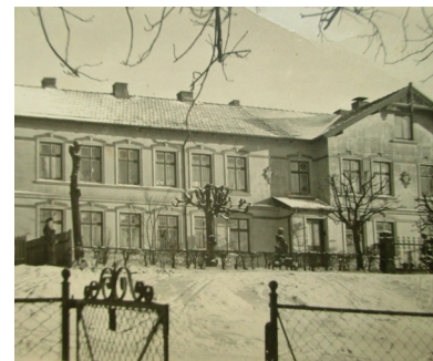
Vorderhaus Struckholt 16 – 18 um 1940 mit den ursprünglichen Fenstern