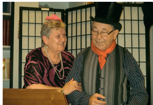
„Senator Biddenbuhl im Etablissement“ (Christa und Wilfried Trompke)