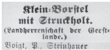
Eintrag im Adressbuch von 1896