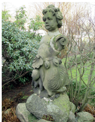
Engel im Garten