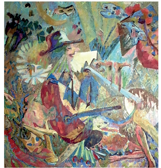
„Herbstaussstellung“ Spätwerk von Wilhelm Ohm 1965 „Commedia dell'Arte“

Öffnungszeiten: Samstag von 15:30 – 17:30 Uhr, Sonntag von 11:00 – 13:00 Uhr sowie nach Vereinbarung.