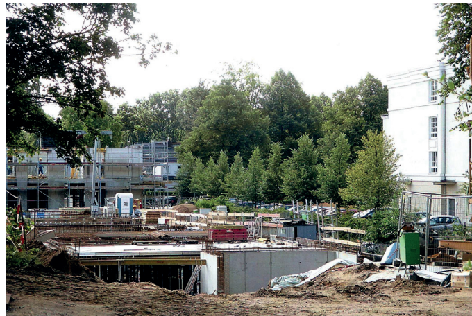
Das Foto zeigt das Baufeld 3, aufgenommen von der Sengelmannstraße. Im Hintergrund: das neue Gebäude von Pflegen & Wohnen Alsterberg.

Wenn Sie glauben, dass Werbung niemand liest – haben wir Sie gerade vom Gegenteil überzeugt!