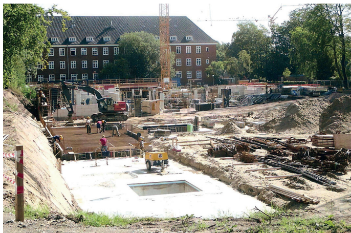
Das Foto zeigt die Baufelder 1 und 2, aufgenommen vom Suhrenkamp. Im Hintergrund: das ehemalige Gebäude von Pflegen & Wohnen Alsterberg.

der Freiraumplanung entsprechend Baumbestand vorgesehen wird. Im Hauptausschuss am 6. Januar 2015 wurde der Name „Alsterhain“ beschlossen. Das Staatsarchiv meldete jedoch Bedenken aufgrund Verwechslungsgefahr im Rettungsfall mit