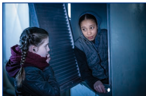
MICHEL Filmfest S.04 Spannende Filme aus aller Welt