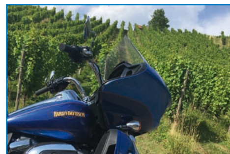
Harley-Gourmet-Tour S.12/S.13 Der klingende Weinberg