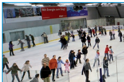
Eissporthalle im Volkspark S.05 Eislaufen am Wochenende