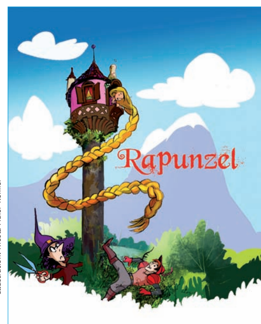
Illustration: Nicola Mater-Reimer

Online-Tickets unter www.komoedie-hamburg.de