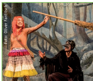
Die kleine Hexe S.08 im St. Pauli Theater