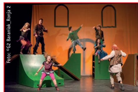
Ronja Räubertochter S.11 im Altonaer Theater