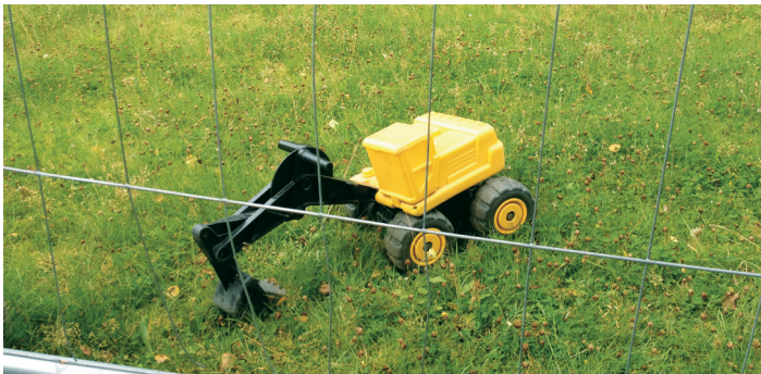
Bild: Schnappschuss aus dem Scala Sportkindergarten www.scala-sportclub.de

Ich weiß das hat keinen direkten Langenhornbezug. Aber auch alle Langenhorner sind davon betroffen. Deshalb musste ich das zur Jahresende los werden.