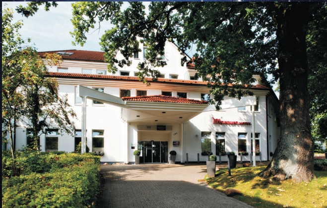
Mercure Hotel Hamburg Airport

1. Weihnachtsfeiertag von 11-15:00 Uhr zum Weihnachtspreis von 32,50 Euro/Person. Enthalten darin ist auch 1 Glas Begrüßungssekt pro Person (Saft oder Wasser für Kinder)