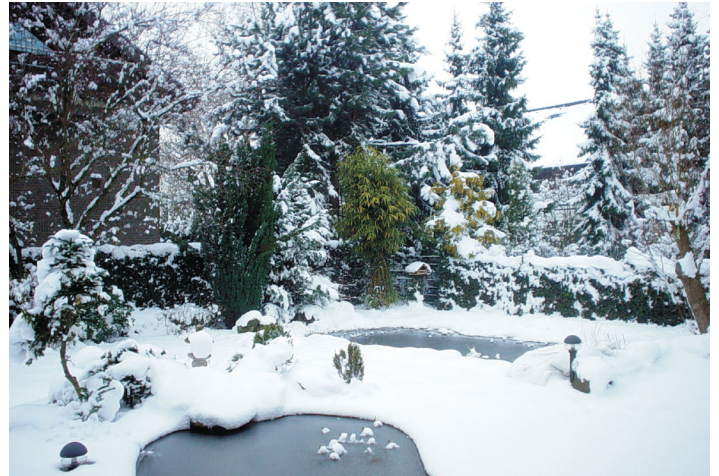
Kommen Sie gut durch den Winter! Mehr Tipps gibt es im nächsten Jahr.

Die Fische in unserem Gartenteich brauchen Sauerstoff. Durch das Freihalten einer kleinen Fläche können Faulgase entweichen und die Fische erhalten Sauerstoff. Bei Binsen