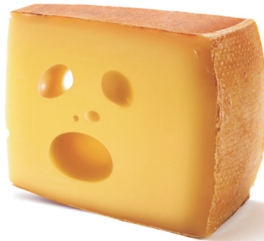
Jedes achte Lebensmittel, das wir kaufen, werfen wir weg. Das können wir ändern!

Suppen werden im Warmen schnell schlecht. Der Topf auf dem Herd ist also der falsche Platz für übrig gebliebene Brühe. Damit sie lange hält, sollte man sie nach dem Kochen in saubere und dicht schließende Behälter füllen. Wenn die Suppe schon ausgekühlt ist, gehört sie ins oberste Kühlschrankfach – hier ist sie zwei bis drei Tage haltbar. Übrig gebliebene Suppen lassen sich gut tiefkühlen. Dazu füllt man dicht schließende Plastikbehälter bis zwei Zentimeter unter den Rand mit Flüssigkeit. Der Grund: Wenn die Box zu voll ist, drückt die Suppe den Deckel auf. Sie breitet sich beim Gefrieren aus. Im Eisschrank halten Suppen etwa drei Monate lang. Tipp: Wer Brühe stark einkocht, kann