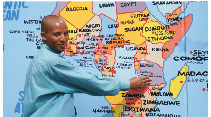
Hier in Ostafrika liegt Tansania. Der rote Punkt bezeichnet (in-etwa) die Region Ulanga Kilombero

Dazu gehört die Ausbildung von Erziehern und für die Ärmsten die Zahlung des Schulgeldes (umgerechnet 3 Euro im Monat für Unterricht, warme Mahlzeit und Schulkleidung)