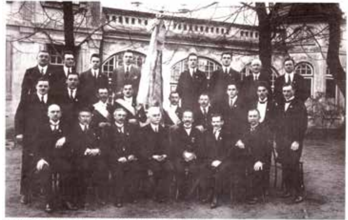
Der Vorstand des Langenhorner Gesangvereins vor der „Harmonie“ (aufgenommen 1910).

hundert Sänger von Bass und Tenor angewachsen. 1910, als der Verein sein 44stes Stiftungsfest feierte, waren allein vierundzwanzig Herren im Vorstand!