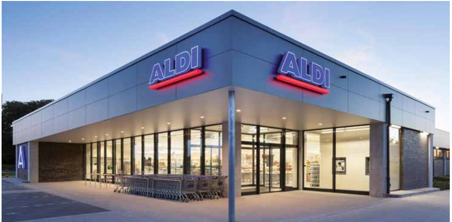
Prototyp einer neuen Aldi-Filiale

Der Stadtteilrat Essener Straße war im Oktober so gut besucht wie schon lange nicht mehr. Aldi stellte die Pläne für jene Filiale vor, die ab Jahresende 2017 auf dem ehemaligen Hotel-Tomfort-Gelände eröffnen soll. Aber auch sonst lohnt sich ein Einblick in die Arbeit des Stadtteilrats.