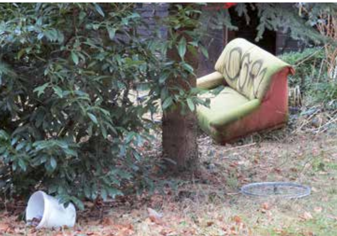
am 3. März 2017