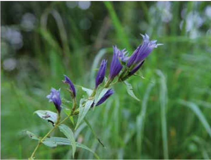
Lungenenzian, Foto R. Radach

Um 12 Uhr ist der Arbeitseinsatz beendet. Es ist wieder viel geschafft: Die Trampelpfade sind unpassierbar gemacht, ein Stauwerk kontrolliert und nebenbei Müll am Wegesrand aufgesammelt worden. Zwischendurch war Zeit, einen besonders großen Baumpilz zu bewundern und den Flug eines Mäusebussards zu beobachten. Geärgert haben sich die Naturschützer allerdings auch: Sie haben Gartenabfälle gefunden, die in einem Naturschutzgebiet nicht abgeladen werden dürfen, weil dadurch Pflanzen in das Gebiet gelangen, die nicht dorthin gehören und