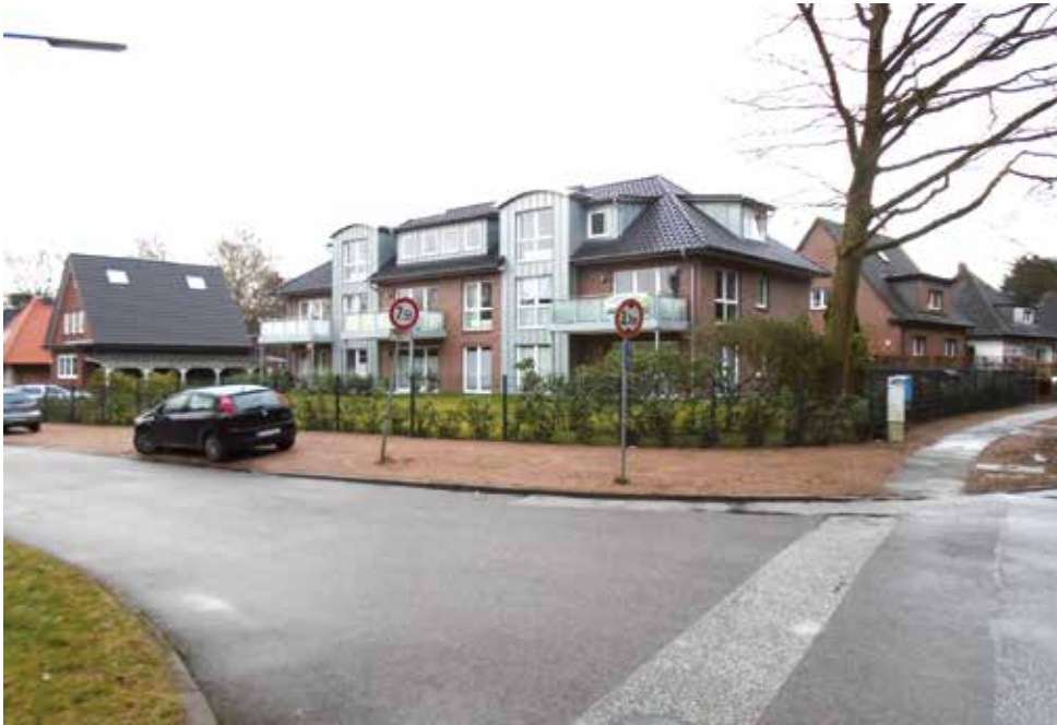
Da wundern sich die Nachbarn: Bild von der Straßenecke Fibigerstraße/Fosberger Moor - ein Gebäude mit 9 Wohnungen in einem Einzelhausgebiet.