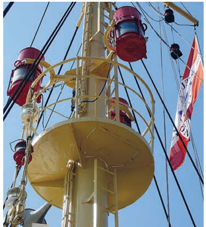
Leuchtsignale im Mast