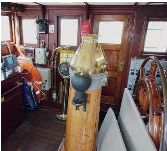
Brücke mit altem Steuerrad

Das Feuerschiff „Elbe 3“ ist ein einmaliges und unübersehbares schwimmendes Denkmal, das über die zwei Jahrhundert alte Geschichte der bemannten Feuerschiffe an der Nordseeküste berichten kann. Feuerschiffe wiesen Schiffen den sicheren Weg in die Flussmündungen. In der Zwischenzeit sind sie ausnahmslos durch automatisierte Seezeichen ersetzt worden. Ursprünglich wurde das Schiff als Ersatz für das betagte Feuerschiff „Weser“ 1888 in Bremen als eines der ersten genieteten Eisenrumpf-Feuerschiffe Deutschland gebaut. Es war als Dreimastschoner mit Hilfsbesegelung getakelt und führte an allen drei Masten nachts ein Petroleum-Rund-um-Leuchtfener. Als Tagessignal hing an einer Mastspitze ein großer roter Korball.