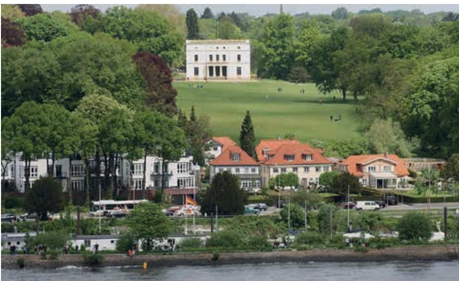
Die grüne Lunge Othmarschens, der Jenischpark mit dem Jenischhaus