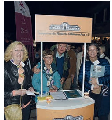
Der Stand des Bürgervereins

Am 21. September fand wieder das Lichterfest in der Waitzstraße, der Reventlowstraße und am Beselerplatz statt. Der Bürgerverein und auch der Archiv-Verein besetzten unseren Stand und informierten interessierte Bürger über unsere Arbeit. Dabei fanden auch einige Chroniken zum Jubiläum „700 Jahre Othmarschen“ ein neues Zuhause!