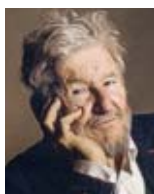
Achim Freyer (Regie, Bühne und Kostüme)

gilt weltweit als einer der herausragenden Opern- und Konzertdirigenten. Er war Musikdirektor des Berkeley Symphony Orchestra, der Opéra National de Lyon, des Hallé Orchestra und der Los Angeles Opera sowie künstlerischer Leiter und Chefdirigent des Deutschen Symphonieorchesters Berlin. Von 2006 bis 2013 war er Generalmusikdirektor der Bayerischen Staatsoper. Seit 2006 ist Kent Nagano zudem Musikdirektor des Orchestre Symphonique de Montréal, seit 2013 auch Erster Gastdirigent der Götterberger Symphoniker. Er gastiert regelmäßig in allen wichtigen Musikmetropolen. Seit 2015/16 hat er aus Kalifornien stammende Dirigent das Amt des Hamburgischen Generalmusikdirektors inne. Er dirigierte hier u. a. die Premieren von Les Troyens , Stilles Meer , Lulu , La Passione , Die Frau ohne Schatten , Mahler 8 und Turungalila (Ballett).