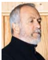
Willy Decker (Regie)

begann seine Laufbahn als Solo-Hornist bei der Akademie für Alte Musik Berlin. 2005 gründete er das Collegium Vocale 1704, das sich unter seiner Leitung rasch zu einem der führenden Ensembles für Alte Musik etablierte. Gastspiele beinhalten Auftritte bei den Salzburger Festspielen, in der Berliner Philharmonie, am Theater an der Wien, im Konzerthaus Wien, im Concertgebouw Amsterdam, beim Lucerne Festival sowie als artist in residence bei den renommierten Festivals Alte Musik Utrecht und Bachfest Leipzig. Er konzertierte mit weiteren Ensembles wie dem La Cetra Barockorchester Basel und dem Dresdner Kammerchor. Václav Luks spielte als Dirigent wie auch als Kammermusiker Aufnahmen für die Label Accent, Supraphon und Zig-Zag Territoires ein und ist Juror bei internationalen Wettbewerben.