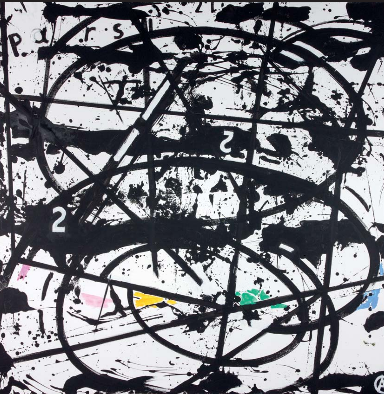
PARSI – Entwurf von Achim Freyer für die Fassade der Staatsoper