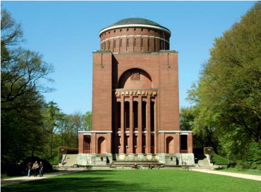
Das Planetarium in Hamburg