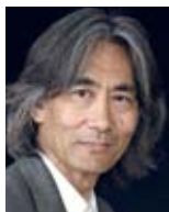
Kent Nagano (Musikalische Leitung)

gilt weltweit als einer der herausragenden Opern- und Konzertdirigenten. Er war Musikdirektor des Berkeley Symphony Orchestra, der Opéra National de Lyon, des Hallé Orchestra und der Los Angeles Opera sowie künstlerischer Leiter und Chefdirigent des Deutschen Symphonieorchesters Berlin. Von 2006 bis 2013 war er Generalmusikdirektor der Bayerischen Staatsoper. Seit 2006 ist Kent Nagano zudem Musikdirektor des Orchestre Symphonique de Montréal, seit 2013 auch Erster Gastdirigent der Götterberger Symphoniker. Er gastiert regelmäßig in allen wichtigen Musikmetropolen. Seit 2015/16 hat er aus Kalifornien stammende Dirigent das Amt des Hamburgischen Generalmusikdirektors inne. Er dirigierte hier u. a. die Premieren von Les Troyens , Stilles Meer , Lulu , La Passione , Die Frau ohne Schatten , Mahler 8 und Turungalila (Ballett).