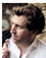
Andreas Schager (Parsifal)

wurde in Südkorea geboren. Der 1. Preis beim »Concours International des Voix d'Opéra Plácido Domingo« in Paris 1993 ebnete seinen Weg zu großen Aufgaben. Er trat u. a. an der Staatsoper Berlin, an der Mailänder Scala sowie in Paris an der Opéra Bastille und am Théâtre du Châtelet auf. Inzwischen ist er regelmäßiger Gast an weiteren wichtigen Opernhäusern wie der Wiener Staatsoper, der Semperoper Dresden, der Metropolitan Opera New York und am ROH Covent Garden. Er gastierte bei den Festspielen in Ludwigsburg und Salzburg und seit 1996 regelmäßig in Bayreuth. Dort gab er 2008 sein Rollendebüt als Gurnemanz in der Parsifal -Neuinszenierung von Stefan Herheim. Auch in Hamburg war er bereits in der Wilson-Inszenierung von Wagners Parsifal als Gurnemanz zu hören.