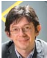
Václav Luks (Musikalische Leitung)

begann seine Laufbahn als Solo-Hornist bei der Akademie für Alte Musik Berlin. 2005 gründete er das Collegium Vocale 1704, das sich unter seiner Leitung rasch zu einem der führenden Ensembles für Alte Musik etablierte. Gastspiele beinhalten Auftritte bei den Salzburger Festspielen, in der Berliner Philharmonie, am Theater an der Wien, im Konzerthaus Wien, im Concertgebouw Amsterdam, beim Lucerne Festival sowie als artist in residence bei den renommierten Festivals Alte Musik Utrecht und Bachfest Leipzig. Er konzertierte mit weiteren Ensembles wie dem La Cetra Barockorchester Basel und dem Dresdner Kammerchor. Václav Luks spielte als Dirigent wie auch als Kammermusiker Aufnahmen für die Label Accent, Supraphon und Zig-Zag Territoires ein und ist Juror bei internationalen Wettbewerben.