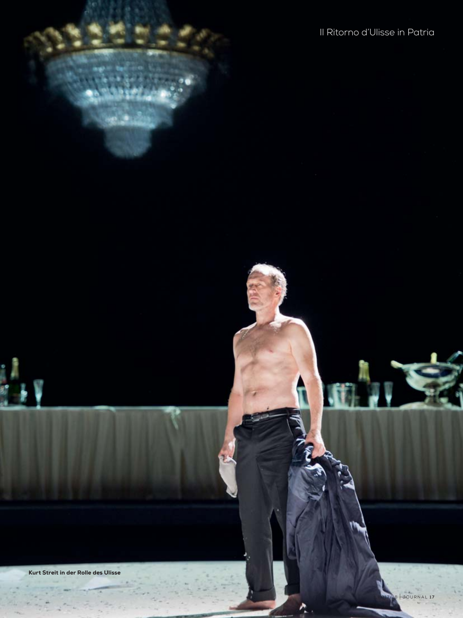
Kurt Streit in der Rolle des Ulisse