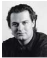
Wolfgang Koch (Amfortas)

ist Maler und Theatermacher. Der Meisterschüler von Bertolt Brecht machte zunächst seine Ausbildung zum Maler, bevor er dann begann am Theater zu arbeiten, wo er als Regisseur sowie als Bühnen- und Kostümbildner seit Jahrzehnten weltweit erfolgreich ist. Seine Hamburger Inszenierung von Mozarts Die Zauberflöte (1982) hat Theatergeschichte geschrieben. Auch seine folgenden Hamburger Arbeiten Vergänglichkeit ( Jowaegerli/Chili ) von Dieter Schnebel (1991) und die Uraufführung von Helmut Lachenmanns Das Mädchen mit den Schwefelhölzern (1997) sorgten für internationale Aufmerksamkeit. Seit 1976 hat Achim Freyer eine Professur für Bühnenbild an der Hochschule der Bildenden Künste Berlin inne. Zahlreiche Einzelausstellungen und Beteiligungen an Gruppenausstellungen als Bildender Künstler führten ihn z. B. auf die Documenta nach Kassel (1977 und 1987) sowie in verschiedene große Städte Europas. Achim Freyer erhielt 1999 den Theaterpreis des ITI (Internationales Theater Institut) und die Goldmedaille für seine Retrospektive zur Quadriennale Prag. 2007 erhielt er den Heinrich Heckroth-Bühnenbildpreis. Zu seinen neueren Opernarbeiten zählen Wagners Ring des Nibelungen an der Los Angeles Opera und am Nationaltheater Mannheim sowie Schönbergs Moses und Aron am Opernhaus Zürich. 2013 wurde in seiner Berliner Villa das Kunsthaus der Achim Freyer Stiftung eröffnet.