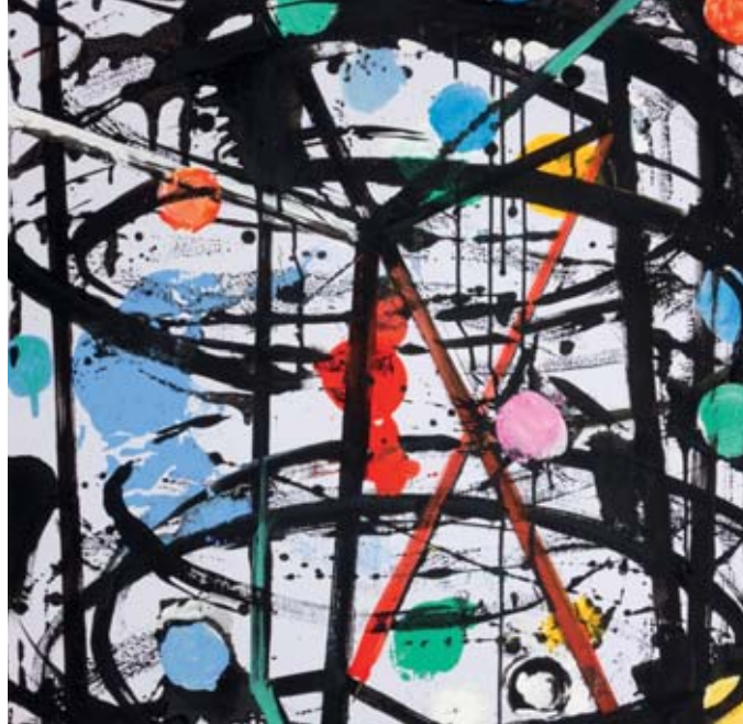
FAL einer der beiden Entwürfe von Achim Freyer für die Fassade der Staatsoper (der andere ist PARSI)