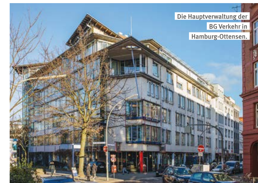
Die Hauptverwaltung der BG Verkehr in Hamburg-Ottensen.