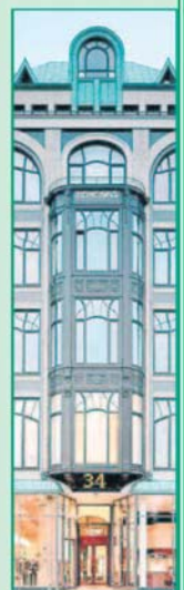
UNSER FIRMENSITZ IM HEINE-HAUS