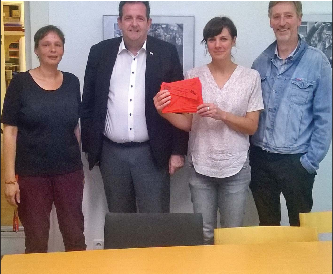
St. Pauli Bürgerverein 1843 vor Ort: Die Kinder vom Abenteuerspielplatz Am Brunnenhof (BauI) und dem Kinderclub der GWA St. Pauli spendete der Hamburger Dom 80 Freifahrten.

Der nächste „Der St.Paulianer“ erscheint am