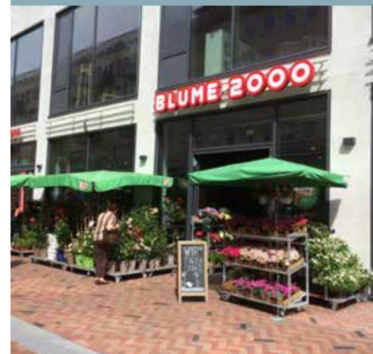
Zurück am alten Standort: Blume 2000