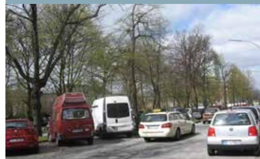
Schon heute steht an vielen Stellen nur eine Fahrspur zur Verfügung