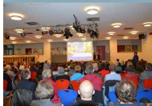
Großes Interesse an der Abschlussveranstaltung

Der Umbau wird voraussichtlich ab 2019 erfolgen. Alle Informationen zu den Planungen und dem Verfahren finden Sie unter lsbg.hamburg.de .