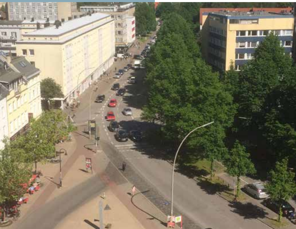
Bei Rot staut sich der Verkehr auf der Kreuzung

Durch die Planungen zur künftigen Führung des Radverkehrs sind die bestehenden Radwege überflüssig und werden