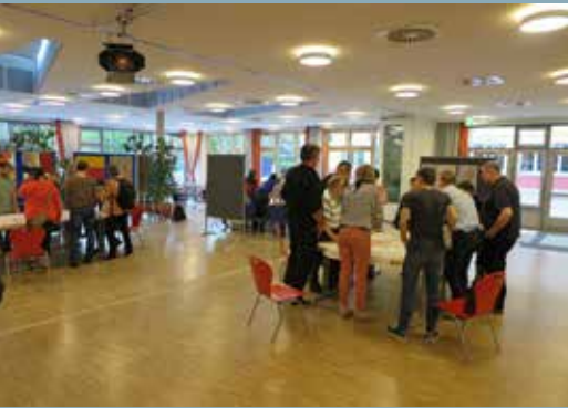
Der Planungsworkshop fand am 18. Mai 2017 statt