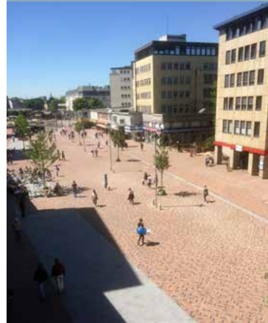
Blick Richtung Max-Brauer-Allee

Allmählich kehrt wieder der Alltag ein. Die Menschen schlendern durch die Fußgängerzone, erledigen ihre Einkäufe oder suchen eine der vielen Arztpraxen auf. Viele Passanten genießen das schöne Wetter auf einer der neuen Sitzbänke oder in den Restaurants und Cafés, die Tische und Stühle nach draußen gestellt haben. Mittwochs und samstags trifft man sich jetzt wieder auf dem Wochenmarkt in der Neuen Großen Bergstraße - und die Fußgänger und Fahrradfahrer versuchen nach wie vor miteinander klarzukommen.