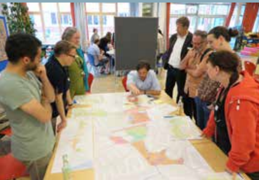
In Arbeitsgruppen wurde das Konzept weiterentwickelt