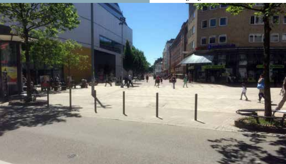
Poller verhindern das Befahren des Goetheplatzes

Dem wurde jetzt Einhalt geboten. Mitte Mai hat das Bezirksamt Altona, in Abstimmung mit der Polizei, den Goetheplatz entlang der Großen Bergstraße mit Pollern abgeriegelt. Mit Erfolg.