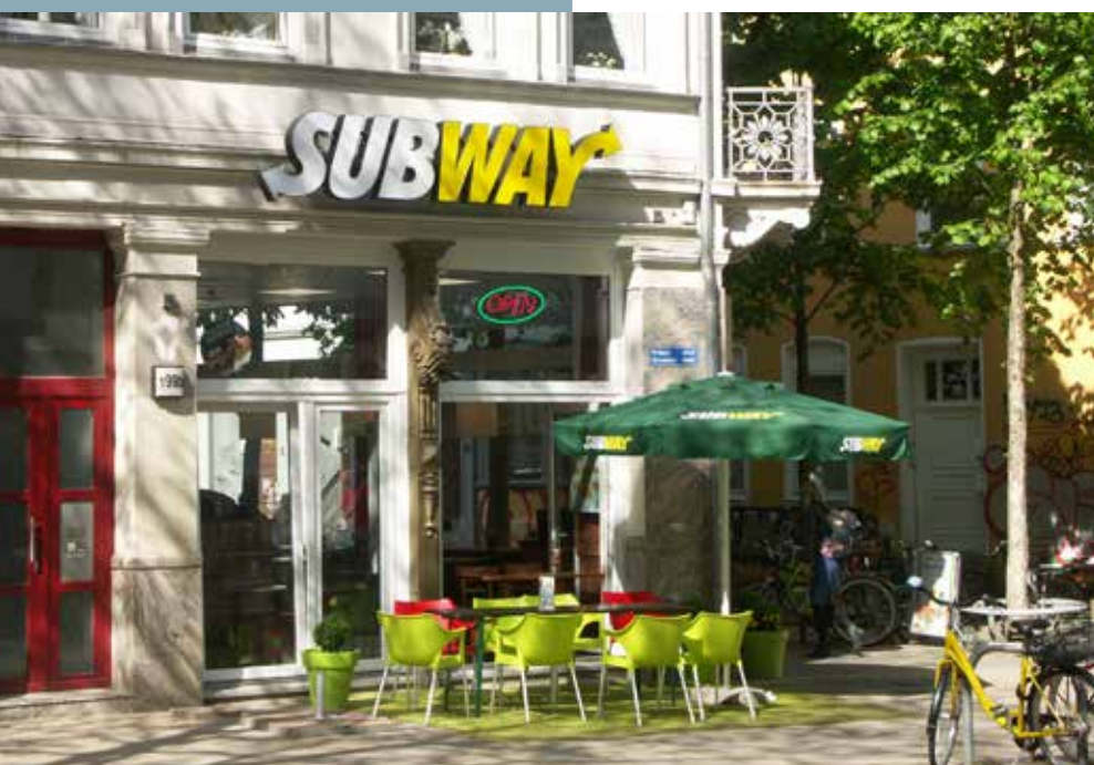
Statt Bargeldtransfer gibt es jetzt Sandwiches

Mit der Neueröffnung der zweiten SUBWAY-Filiale in Altona wird die Gewerbeinheit nun seit Ende Februar wieder für Gastronomie genutzt.