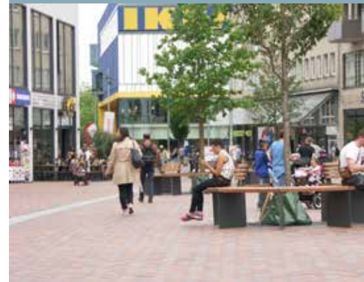
Viele neue Sitzgelegenheiten