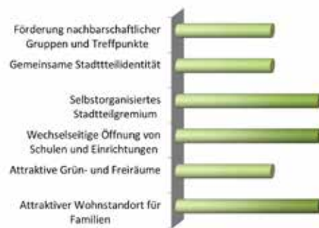
Bilanzierung der Leitziele

Luftbild 2014