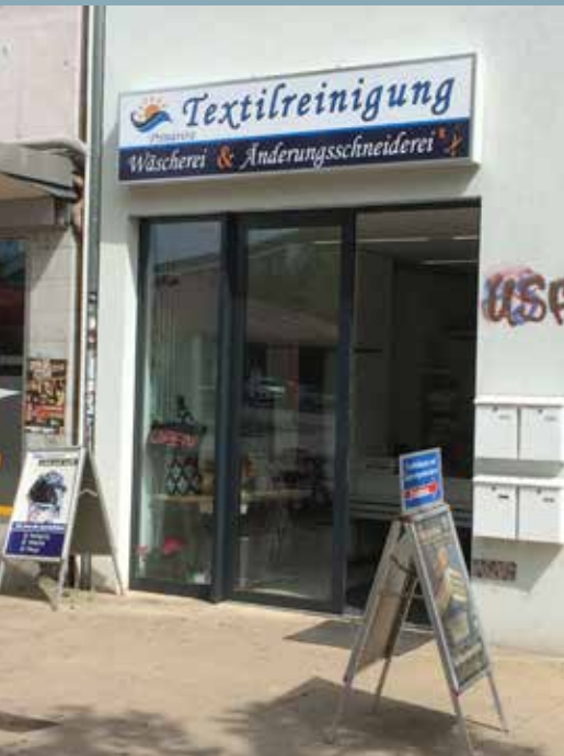
Weiterhin in der Straße: Die Textilreinigung Primavera