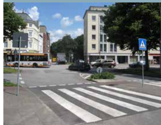
Blick aus Richtung Süden auf die heutige Kreuzung

Der Sanierungsbeirat begrüßt den geplanten Umbau, sieht bei einigen Punkten der Planung aber noch Verbesserungsbedarf - insbesondere bei der Ein- und Ausfädelung des Radverkehrs in den Kreisel (Ostseite). Der Beirat fordert hier eine separate Führung des Radverkehrs bis in den Kreisverkehr. Sollte die Bezirkspolitik zustimmen, kann im kommenden Jahr mit der Realisierung der Maßnahme begonnen werden.