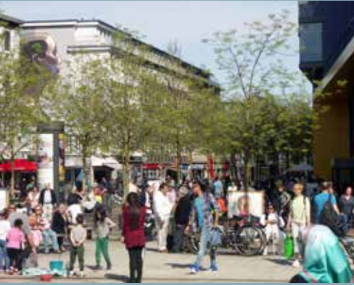
Der "Goetheplatz" hat sich zum Treffpunkt entwickelt

Hier kennt ihn fast jeder, aber es gibt ihn gar nicht ..., den „Goetheplatz“ im Herzen von Altona-Altstadt. Der neu gestaltete Bereich, zwischen dem Ikea-Einrichtungshaus und dem Wohn- und Geschäftsgebäude „Bergspitze“, ist nämlich offiziell nur eine Straßenkreuzung zwischen Großer Bergstraße, Neue Große Bergstraße, Altonaer Poststraße und Goethestraße.