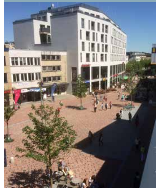
Blick Richtung „Goetheplatz“