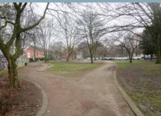
Derzeit besteht an vielen Ecken des südlichen Grünzugs Handlungsbedarf