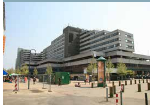
Die Situation zu Beginn des Sanierungsverfahren

Wenn der Leitungsausschuss Programmsteuerung, des Hamburger Rahmenprogramms Integrierte Stadtteilentwicklung (RISE), der im Juli tagt, den Ergebnissen und Empfehlungen der nun vorliegenden Abschlussbilanzierung folgt, wird das Sanierungs- und Stadtumbauverfahren Ende 2017 abgeschlossen.