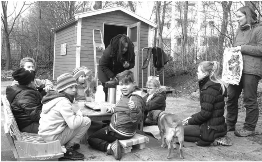
Es gibt viel zu tun im Juca-Garten, aber jetzt ist erst einmal Pause