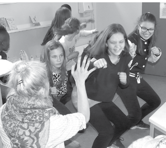
Mitreibende Präsentation der SpoXX-Coaches der Stadtteilschule Lurup

Runder Tisch Gesundheitsförderung tagte in der Stadtteilschule Lurup