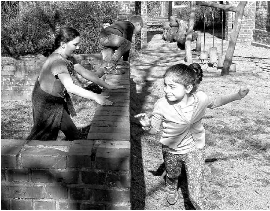
Streitschlichter beim Parkour-Trainings im alten Straßenbahndepot.

ne Mauern gesprungen u.v.m. „Es braucht nur ganz wenige einfache kleine Hindernisse und schon gibt es für die Kinder ein spannendes Trainingsgelände. Das sollte bei der Neugestaltung des Eingangsbereichs beim Neubau der Stadteilschule Lurup mit überlegt werden. Auch das Juca Lurup hat Interesse an einem Parkourtraining für Jugendliche. Dafür braucht man aber gute Trainer.“