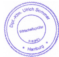
U. Sommer Wirtschaftsprüfer