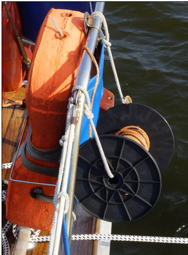
Abbildung 7: unsachgemäße Befestigung der zum Rettungskragen gehörenden Seiltrommel

Die nachfolgende Abbildung 7, die anlässlich einer Besichtigung der Yacht im Herbst 2016 entstand, belegt jedenfalls, dass zumindest bei der Art und Weise der Montage der Seiltrommel selbst nach dem Unfallereignis nicht genügend darauf geachtet wurde, dass ein für das Abwickeln der Leine erforderliches freies Drehen der Trommel gewährleistet ist.