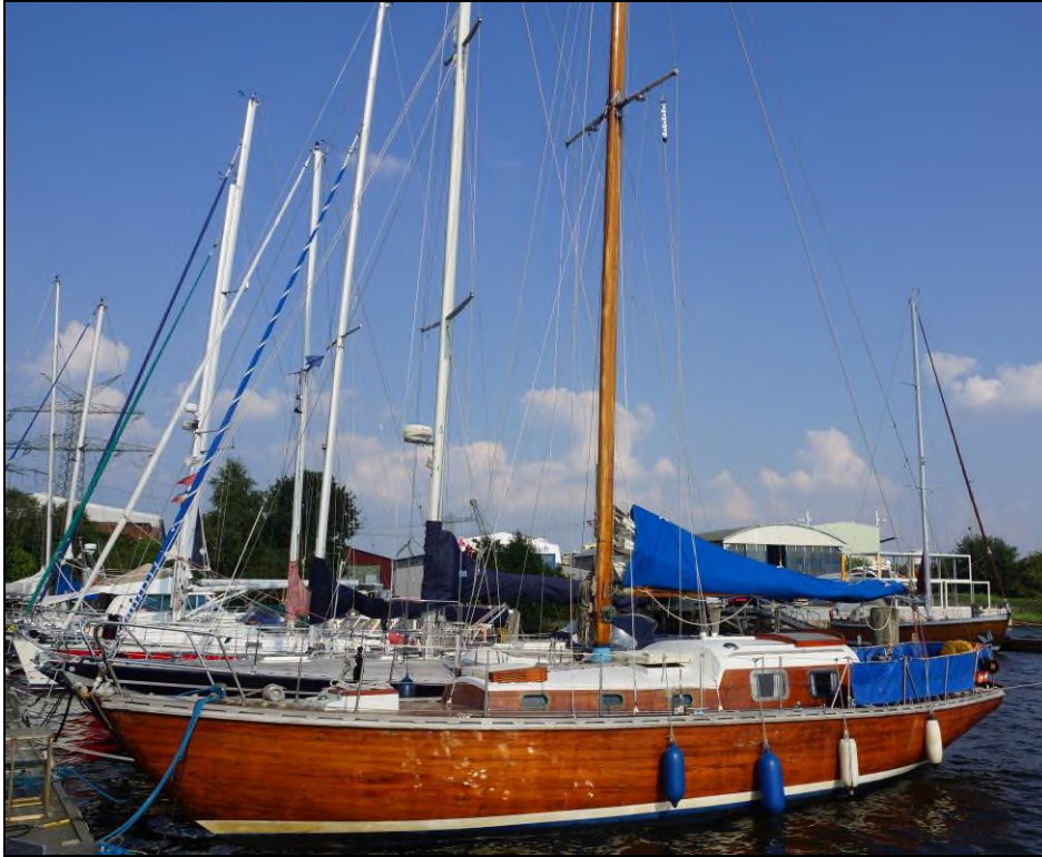
Abbildung 1: Schiffsfoto SY DESDEMONA