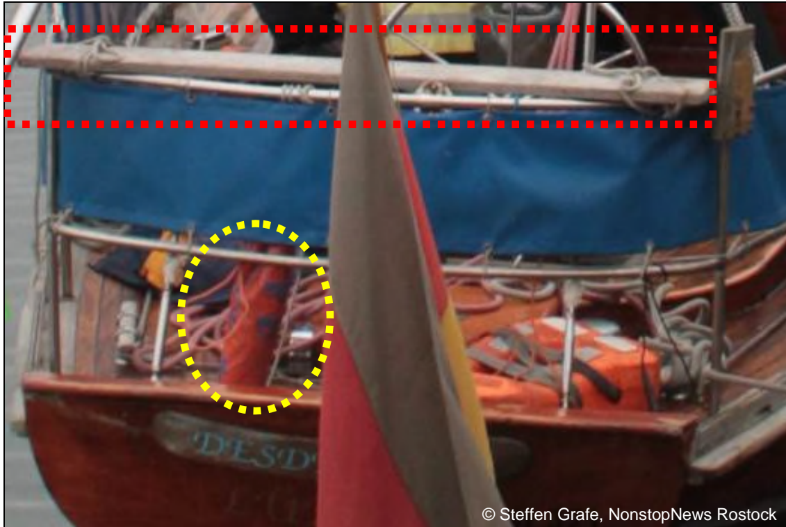
Abbildung 8: Heck der DESEMONA (am Unfalltag nach dem Einlaufen in Warnemünde)

auszuschließen, dass dieses Brett das Abrollen der Rettungsleine (zusätzlich) behindert hat. Gegen eine solche Möglichkeit spricht aber die eindeutige Zeugenaussage, nach der die Leine sich beim Werfen des Kragens nicht von allein abrollte und anschließend „wegen einer Verknotung“ bzw. „weil sie nicht richtig aufgewickelt war“ auch nicht manuell von der Trommel abziehen ließ.