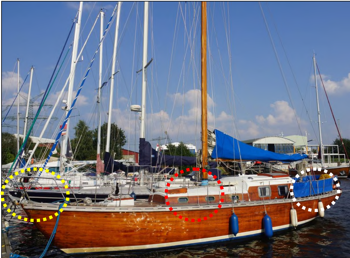
Abbildung 4: Aufenthaltsorte der Besatzungsmitglieder zum Unfallzeitpunkt

In der nachfolgenden Abbildung 4 , die die DESDEMONA zu einem späteren Zeitpunkt an ihrem Liegeplatz in Lübeck-Travemünde zeigt, sind die vorstehend beschriebenen Positionen, an denen sich die vier Besatzungsmitglieder unmittelbar vor bzw. zum Unfallzeitpunkt befanden, farblich markiert. Innerhalb des rot markierten Kreises befand sich das spätere Unfallopfer.