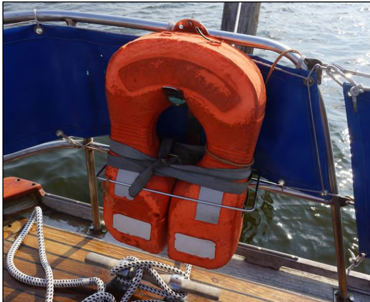
Abbildung 5: Rettungskragen im achteren Bereich der Yacht