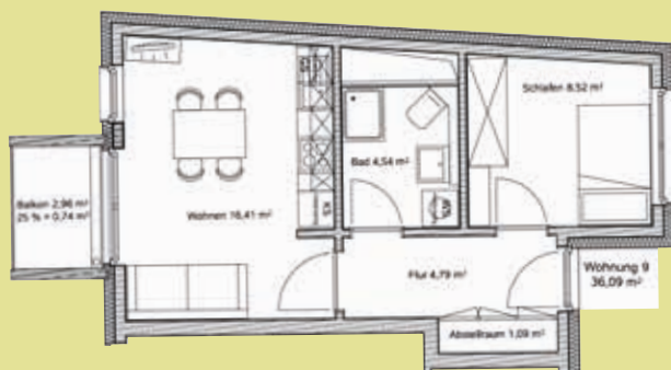
Grundrissbeispiel für eine Eineinhalb-Zimmer-Wohnung.

Der BAUVEREIN errichtet an zwei attraktiven und zentralen Standorten in Harburg neue Wohnungen für seine Mitglieder.