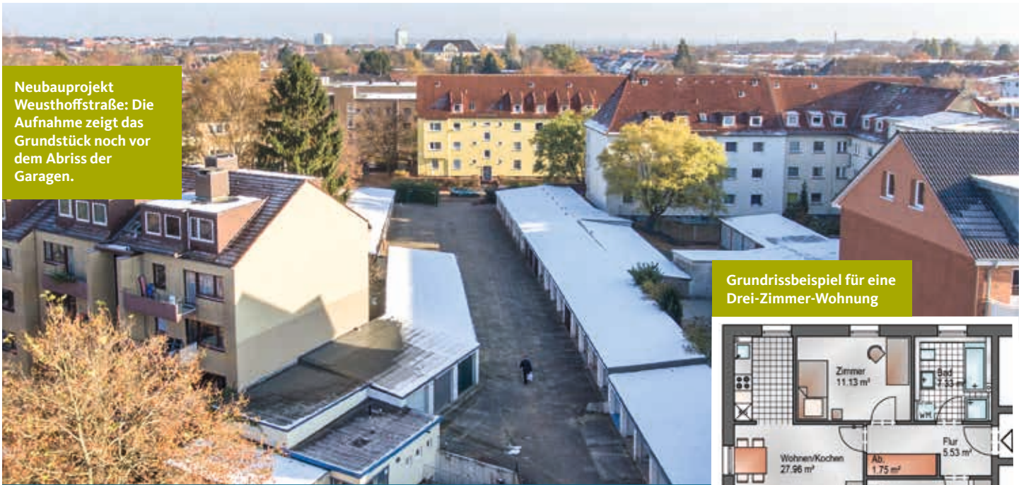
Grundrissbeispiel für eine Drei-Zimmer-Wohnung

Neubauprojekt Weusthoffstraße: Die Aufnahme zeigt das Grundstück noch vor dem Abriss der Garagen.