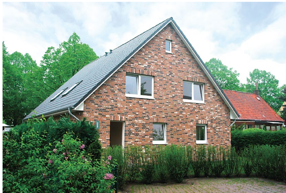
Doppelhaus in Lütt Iserbrook – gebaut mit Team Massivhaus

Die Doppelhäuser werden als KfW 70 Häuser mit Team Massivhaus erstellt. Jede Wohneinheit wird eine Wohnfläche von rund 112 m 2 haben und dank eines modernen Grundrisses viel Platz für die ganze Familie bieten. In der gleichen Bauweise wurden auch in Lütt Iserbrook bereits mehrere Mieteinheiten errichtet. Ein Doppelhaus ist hier derzeit kurz vor der Fertigstellung und wird voraussichtlich noch in diesem Jahr von den neuen Bewohnern bezogen. In der Andersenstraße ist der Baubeginn noch in 2016 geplant. Die Fertigstellung wird voraussichtlich in 2017 erfolgen.