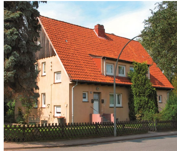
Altes Siedlungshaus in Hamburg-Iserbrook

Viele dieser alten Siedlungshäuser gehören heute zum Wohnungsbestand des BVE. Da sie mittlerweile schon in die Jahre gekommen sind, werden sie nach Auszug der Mitglieder nach und nach durch moderne Neubauten ersetzt. In den letzten Jahren ist somit in Iserbrook viel neuer Wohnraum hinzugekommen. In der Andersenstraße und Grimmstraße wurden in mehreren Bauabschnitten insgesamt 14 Häuser mit jeweils vier großzügigen Wohneinheiten errichtet. Im nächsten Bauabschnitt werden hier auf zwei gegenüberliegenden Grundstücken insgesamt sechs Doppelhäuser mit zwölf Mieteinheiten entstehen.