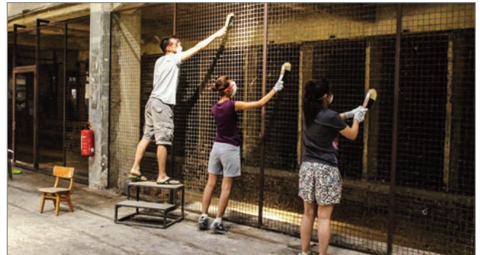
Tatkräftige Unterstützung der Workcamp-Teilnehmer im Klinkerwerk

nen Eindrücken zu befassen. Als wir unsere Schwerpunkte gesammelt hatten, begannen wir aufgeregt, die einzelnen Stationen zu entwickeln. Unser Konzept umfasste nicht nur die Beschreibung der ausgewählten Orte, es war uns darüber hinaus sehr wichtig, unsere eigenen Erfahrungen und Überlegungen in die Arbeit miteinfließen zu lassen und unsere Perspektiven als Teilnehmende des Internationalen Workcamps einzubinden. Wir haben schnell gemerkt, dass die Geschichte der Gedenkstätte von vielen Auseinandersetzungen und Kämpfen um die Erinnerung geprägt ist. Also wurde die Frage nach Erinnerungskultur ein weiterer wichtiger Aspekt unseres Audioguides.