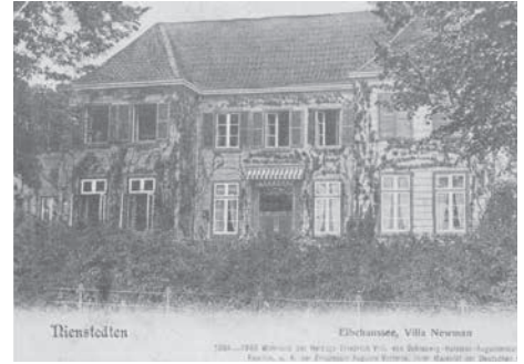
Bild 4. Villa Newman, ein zeitgenössisches Postkartenbild.

Gelegenheit dazu hatte sie, wenn ihr Gemahl Hamburg, Altona oder gar Nienstedten besuchte, z.B. 1906 das nahegelegene Anwesen in der