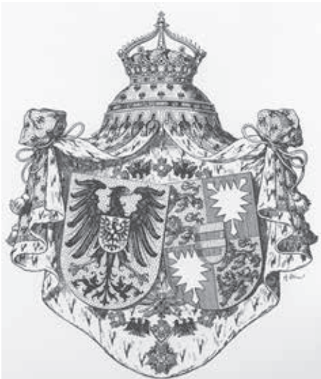
Bild 3. Das Wappen der Kaiserin mit preußischen und schleswig-holsteinischen Schilden.

36. Geburtstag auf der Elbchaussee vor seinem Hause begeistert gehuldigt. Es kam dann anders, die Welt begann „global“ zu werden. Diese komplizierte Geschichte würde heute den Umfang eines ganzen HEIMATBOTEN sprengen. Darum