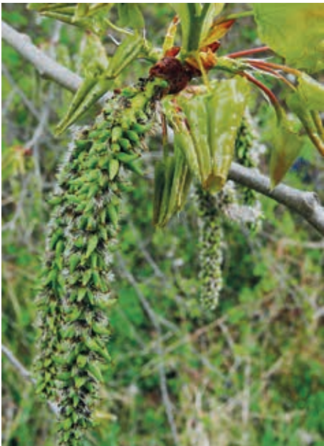
Weibliche Blütenkätzchen der Zitterpalme

zulegen. Sie gehören daher zu den schnellwüchsigsten Bäumen unserer Flora.