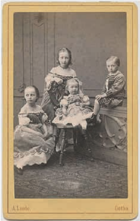
Bild 2. Die Kinder des „Augustenburgers“, links Auguste Victoria.

36. Geburtstag auf der Elbchaussee vor seinem Hause begeistert gehuldigt. Es kam dann anders, die Welt begann „global“ zu werden. Diese komplizierte Geschichte würde heute den Umfang eines ganzen HEIMATBOTEN sprengen. Darum