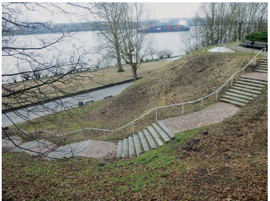
Bild 1. Der elbaufwärts liegende Ausguck mit der alten Dorftreppe, die früher von der Elbchaussee in der Schlucht geradenwegs hinunter führte.

Augustenburg lag hoch im Norden des Herzogtums, heute in Dänemark. Der kurze Aufenthalt der Familie in Nienstedten hatte seinen Grund in den damals schwierigen Beziehungen zwischen Schleswig, Holstein, Dänemark, Preußen und Österreich. Friedrich VIII. von Schleswig-Holstein wollte die Selbstständigkeit des Herzogtums zwischen Dänemark und Preußen erhalten. Ihm wurde deshalb an seinem